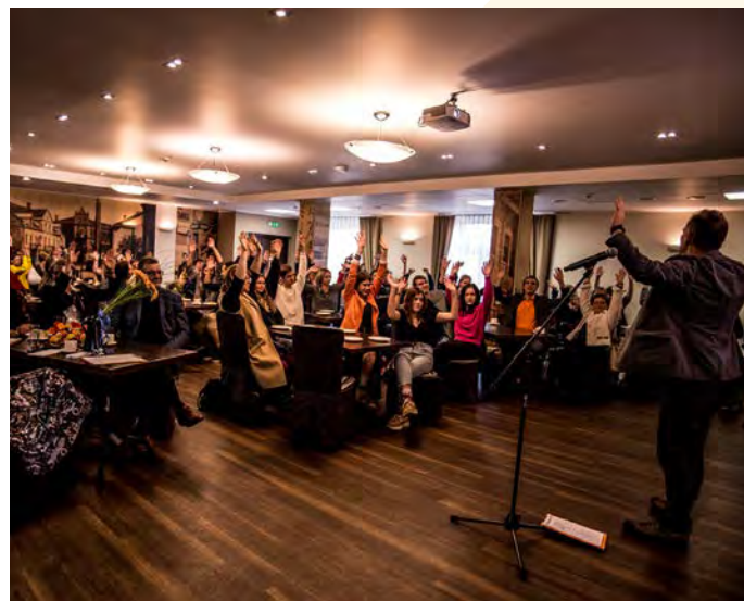
VNF Jauniešu ideju laboratorijas 15 gadu atzīmēšanas pasākums