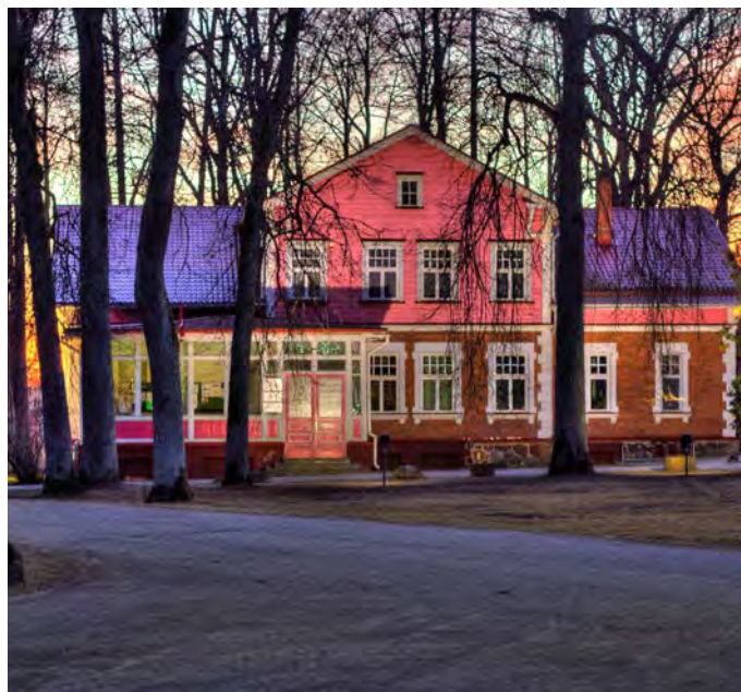
Jērcēnmuiža Leģendu naktī