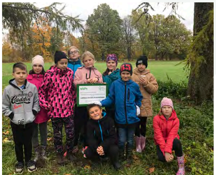
Matīšu pamatskolas 4. klases skolēni pēc lapegļu stādīšanas

Lita Dudele-Krastiņa, Valmieras novada pašvaldība