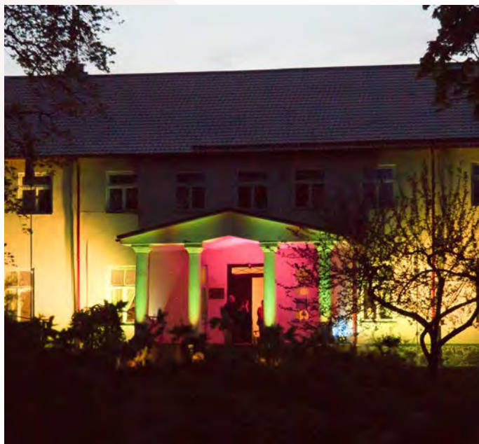
Sēļu muiža