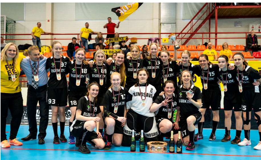
Latvijas čempionāta florbolā ELVI līgas sievietēm bronzas medaļnieces - komanda "Rubene-1"