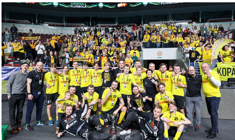
Latvijas vicečempioni florbolā - vīriešu florbola komanda "Rubene"