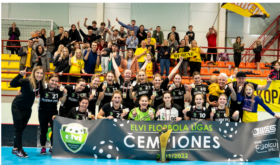
Latvijas čempiones florbolā - sieviešu florbola komanda "Rubene"