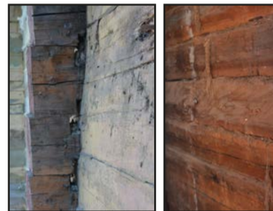
Guļbūve krusta pakšos ar guļbaļķu zelmiņiem