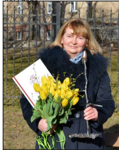
Sveicam un lepojamies!

Starptautiskā nevalstiskā labdarības organizācija Zonta International darbību Latvijā sāka 1993. gadā. Šobrīd Latvijā ir četri Zonta klubi, kuros ir vairāk nekā 60 dalībnieces, iesaistoties mērķprogrammās un projektos, lai uzlabotu meiteņu, jauniešu un sieviešu dzīvi vietējā un starptautiskā mērogā. Valmieras Zonta klubs dibināts 2007. gadā.