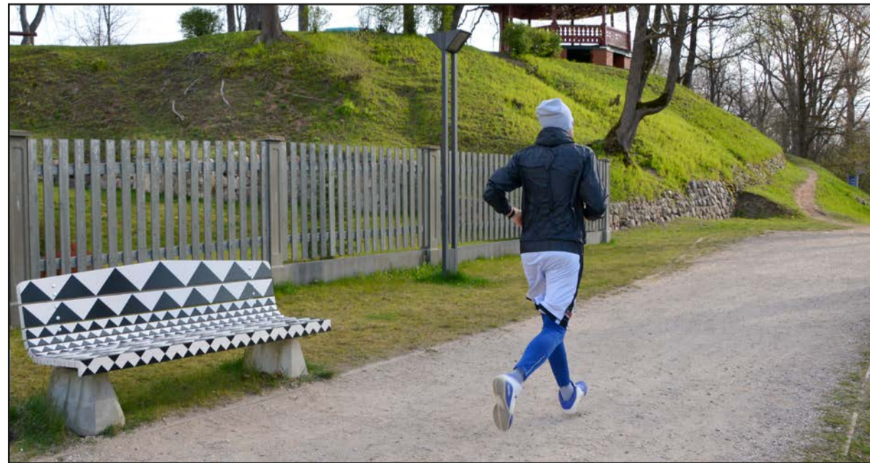
Mākslinieku darinātie soliņi ļauj ikvienam sastapties un piedzīvot mākslu pilsētvidē katru dienu

Kad soliņi būs atrasti, tie jānofotografē, paturot prātā nosaukumu "Soliņš, es un ...", kur daudzpunktes vietā lieciet savu ideju. Žūrija apskatīs un novērtēs katra veiku-