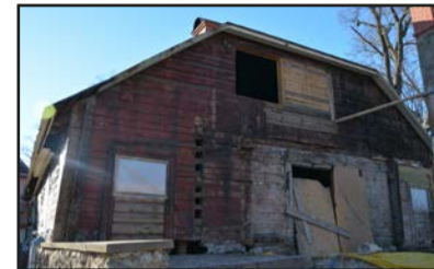
Fasāžu krāsojuma paliekas

bības programmas "Izaugsme un nodarbinātība" prioritārā virzienā "Vides aizsardzības un resursu izmantošanas efektivitāte" 5.5.1. specifiskā atbalsta mērķa "Saglabāt, aizsargāt un attīstīt nozīmīgu