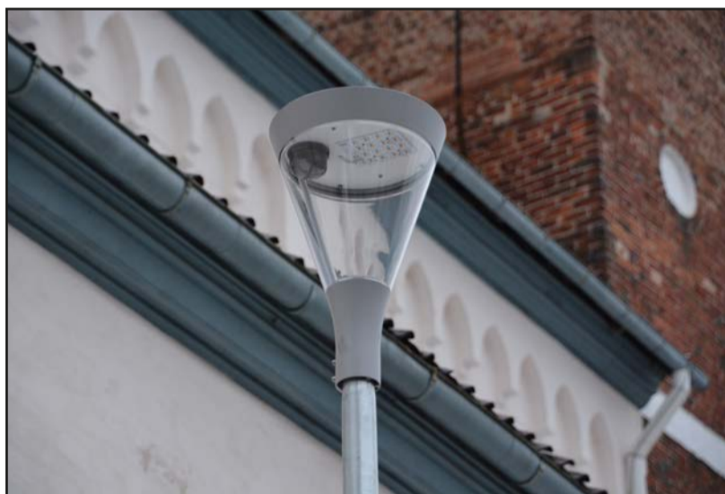
Noslēdzies projekts "Viedo tehnoloģiju ieviešana Valmieras pilsētas apgaismojuma sistēmā"