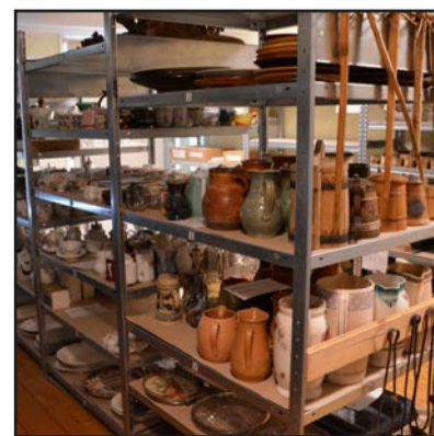
Īpaši glabātas vēstures liecības

"Ir noteikumi, kas nosaka, kā glabājami priekšmeti, jo katram ir savi rādītāji par pieļaujamo gaismas, mitruma daudzumu un cita veida uzglabāšanas īpatnībām. Ir arī metodes, kas var noderēt mājās, piemēram, ja iepļaisājusi koka karote, tā kādu diennakti jāpatur aukstā ūdenī un pēc tam jāieliek saldētavā. Plaša savilksies mazāka."