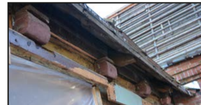
Zem spārenīcas izvirzīti profilēti dziedru gali

kultūras un dabas mantojumu, kā arī attīstīt ar to saistītos pakalpojumus" projekta "Valmieras Vēsturiskā centra attīstība" ietvaros. Projektā vēl ietverta virtuālās ekspozīcijas izveide, kā arī Ziloņu ielas pārbūve. Projekta īstenošanai piesaistīts Eiropas Reģionālās attīstības fonda līdzfinansējums līdz 2 000 000 EUR un valsts budžeta dotācija līdz 70 588,24 EUR.