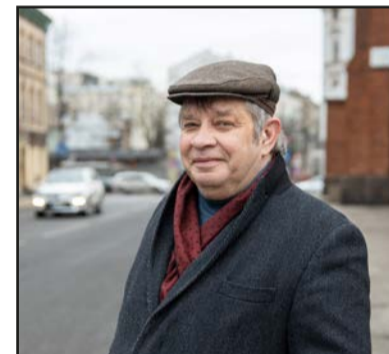
Pateicībā par mūziku un uzticību!

Par to, kāda stīga ir Valmierai, komponists saka: "Grūti definēt, kas ir Valmieras gars, jo Valmierai ir lielas kultūras tradīcijas. Mūzikas skolai 100 gadi, Valmierā ir teātris, kori, baznīca ar ērģelēm. Ir ļoti daudz punktu, caur kuriem Valmierā dzīvo mūzika. Valmierā esmu dzimis un mācījos mūziku, arī šobrīd priecājos par sadarbību ar Valmieras Mūzikas skolu, sekoju līdzi notikumiem, cerams, drīz varēsim tikties arī klātienē koncertos. Tā ir īpaša saikne."