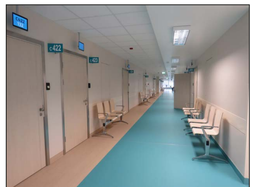
Vidzemes slimnīca kļūst mūsdienīgāka un sakārtotāka