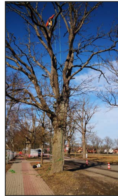
Rūpējamies par Valmieras zaļo rotu

Pilsētas lielo veco koku kopšanā būtiski tos gan pēc iespējas ilgāk saglabāt kā dabisku un zaļu pilsētas rotu, taču vienlaikus rūpēties, lai tā neradītu apdraudējumu iedzīvotājiem un viņu īpašumiem. Tādēļ parkiem, skvēriem un alejām ar lieliem un veciem kokiem Valmieras pilsētas pašvaldība ir pasūtījusi sertificētu koku kopšanas ekspertu veiktus koku stāvokļa novērtējumus jeb inventarizācijas. Par līdz šim veiktajām koku stāvokļa inventarizācijām plašāka informācija pieejama pašvaldības mājaslapas sadaļā "Pilsēta" – "Dabas teritorijas" – "Pilsētas koku novērtējumi".