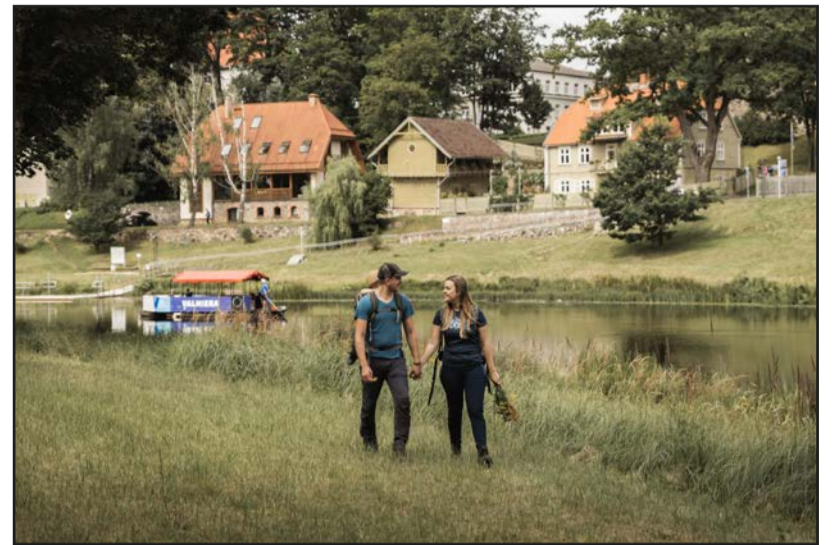
Uz tikšanos Valmierā!

aicinās iepazīt bagātīgo tūrisma piedāvājumu, kas balstīts tradīcijās, dabas un kultūrvēstures mantojumā, kā arī saistošos un interesantos pasākumos.