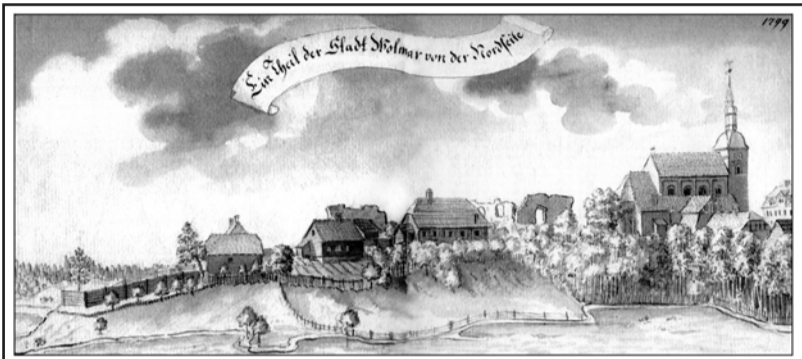
J.K. Broces 1799.gada zīmējums. Skats no ziemeļu puses

Valmieras pilsētas pašvaldībai veicot Valmieras Vecās aptiekas Bruņinieku ielā 1 Valmierā (vidējā no trīs ēkām) pārbūvēšanu Valmieras pils kultūrvides centra ekspozīcijai Eiropas Savienības projekta "Valmieras Vēsturiskā centra attīstība" īstenošanas laikā, atklātas līdz šim nezināmas arhitektoniski vēsturiskās liecības ar nozīmīgu vēstures, zinātnes un kultūrvēsturisko vērtību.