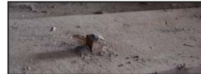
Pirmā stāva griestu dēļu stiprināšanas veids (oriģinālais dēļu klājs uz sijām)