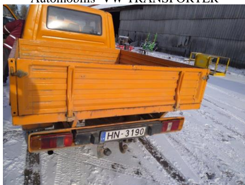
Automobilis VW TRANSPORTER