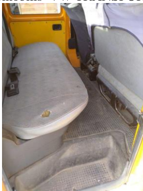
Automobilis VW TRANSPORTER