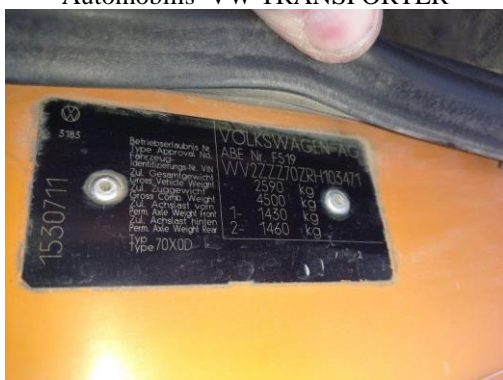
Automobilis VW TRANSPORTER