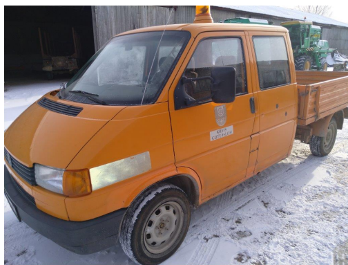
Automobilis VW TRANSPORTER