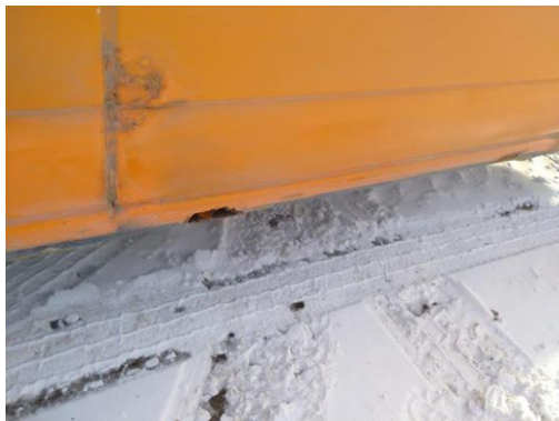
Automobilis VW TRANSPORTER