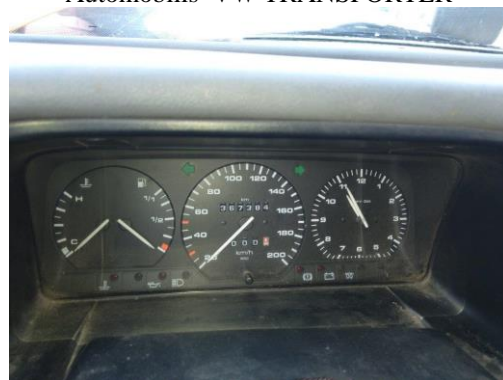
Automobilis VW TRANSPORTER