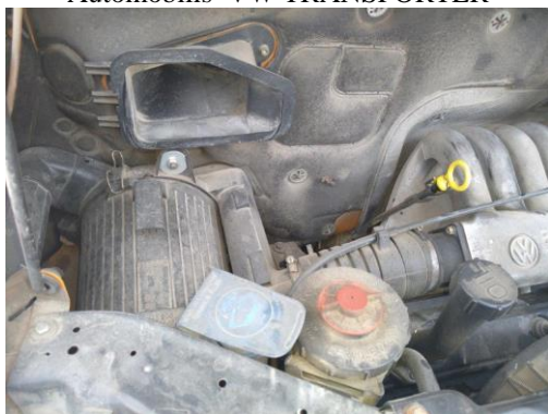
Automobilis VW TRANSPORTER