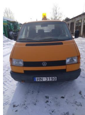
Automobilis VW TRANSPORTER