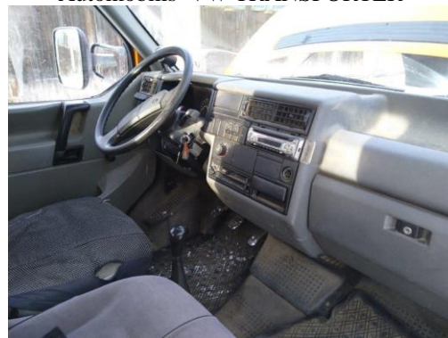
Automobilis VW TRANSPORTER