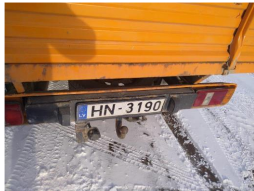
Automobilis VW TRANSPORTER