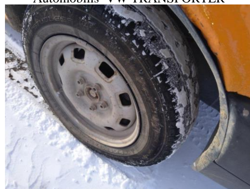
Automobilis VW TRANSPORTER