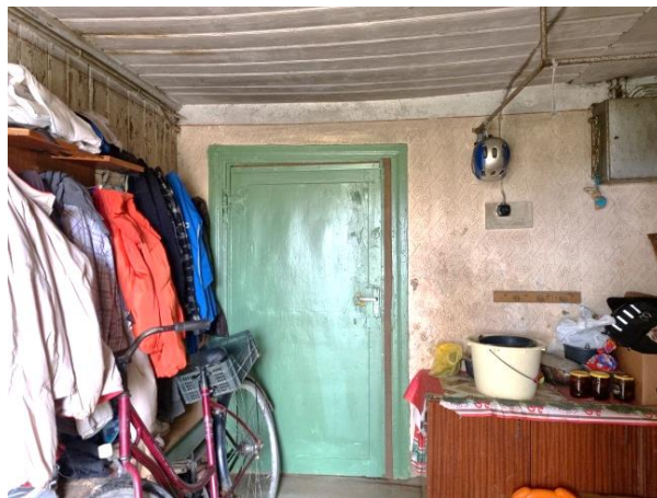
Koplietošanas telpa - gaitenis