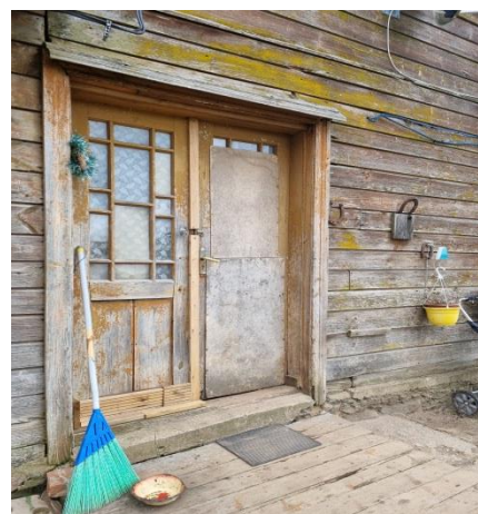
Daudzdzīvokļu mājas ārskati