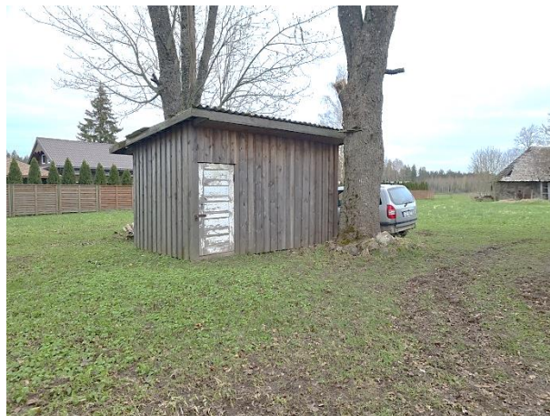
Skati uz palīgkām