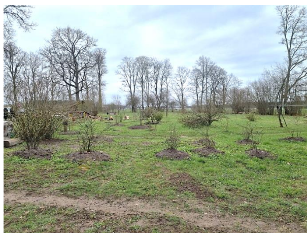
Skati uz teritoriju