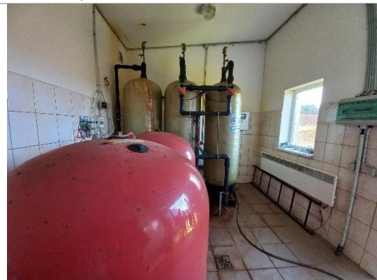
Ūdens sagatavošanas stacijas aprīkojuma komplekts WATEX C2472