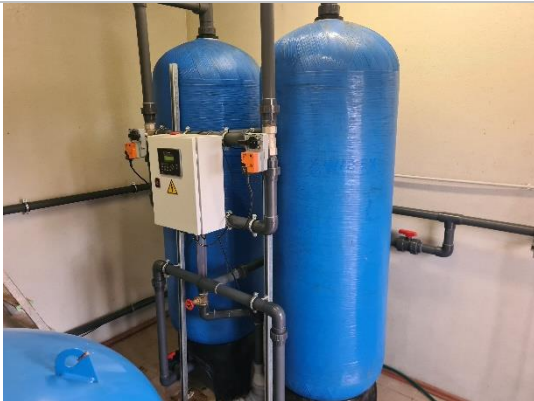
Ūdens sagatavošanas stacijas aprīkojuma komplekts WATEX C2472