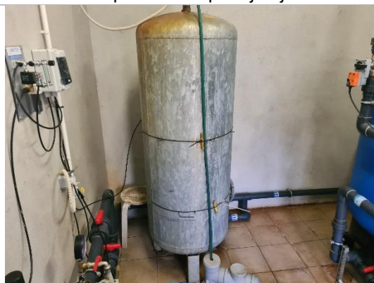
Aukstā ūdens tvertne