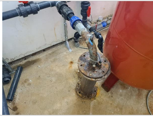
Dziļurbuma sūknis Calpeda 4SDF 54-22