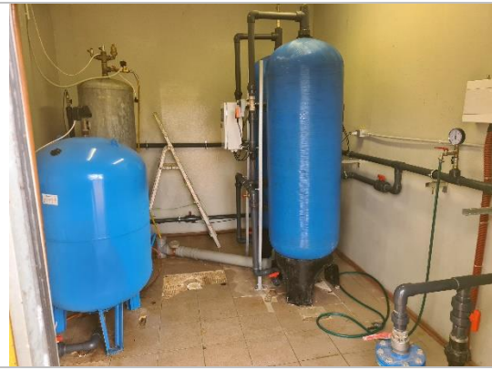
Kopskats uz aprīkojumu