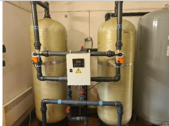
Ūdens sagatavošanas stacijas aprīkojuma komplekts WATEX C2472