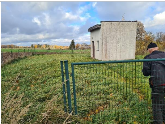
Atdzelžošanas stacija Avotos