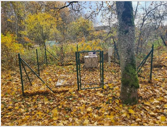
Attīrīšanas iekārta notekūdeņim Eriņi