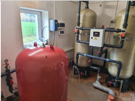
Kopskats uz aprīkojumu