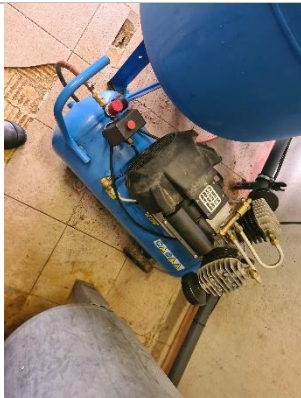
Kompresors NUAIR VDC/50 CM3 LUNA SCK