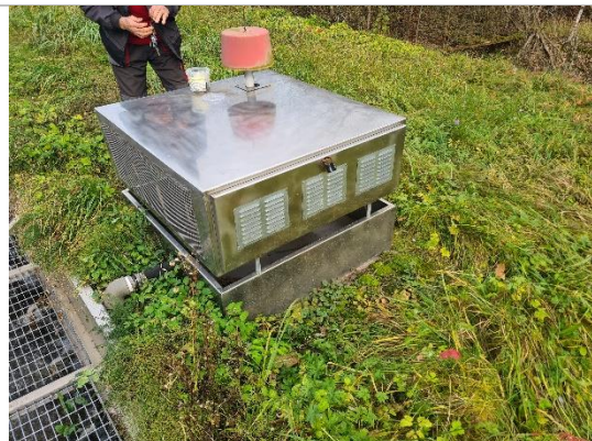
Kompresors attīrīšanas iekārtā - gaisa pūtejs MIVALT RB60-1-7K0