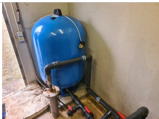
Izplešanā tvertne Elbi 709L125