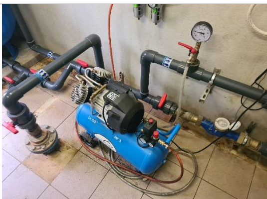
Kompresors NUAIR VDC/50 CM3 LUNA SCK