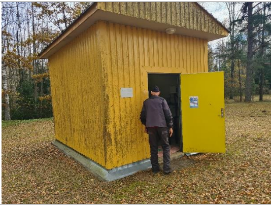
Atdzelžošanas stacija Pārupes