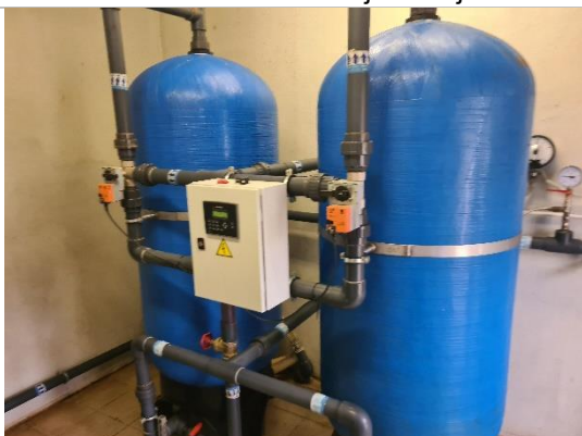
Ūdens sagatavošanas stacijas aprīkojuma komplekts WATEX C2472