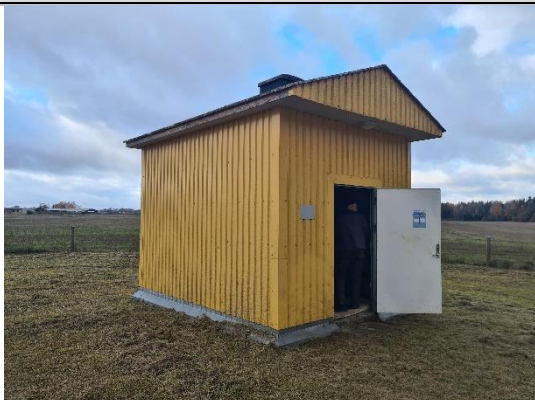
Atdzelžošanas stacija Krauja