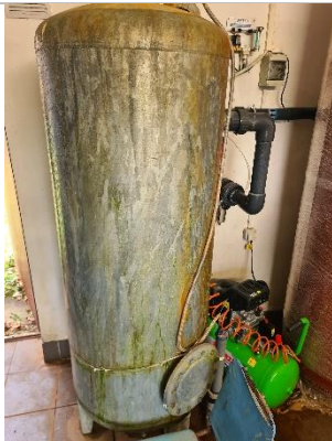
Aukstā ūdens tvertne