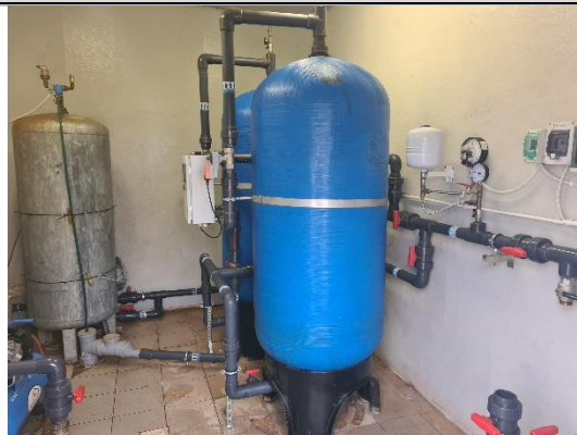
Kopskats uz aprīkojumu