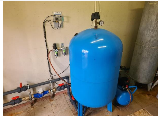
Izplešanā tvertne Imera AV500