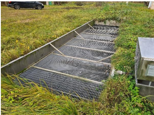
Notekūdeņu attīrīšanas iekārta BIO DRY-BB-125