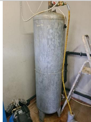
Aukstā ūdens tvertne