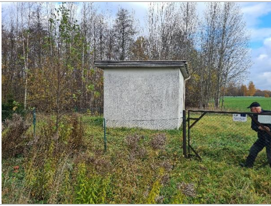
Atdzelžošanas stacija Eriņi