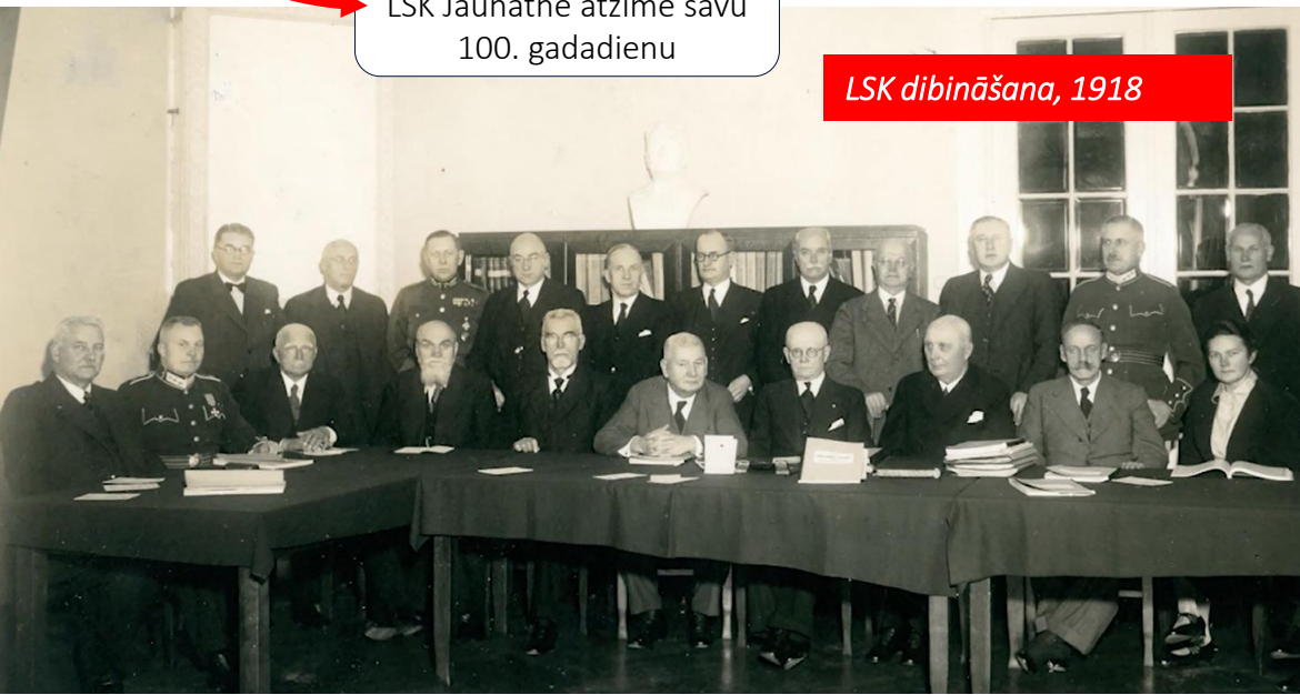
LSK dibināšana, 1918