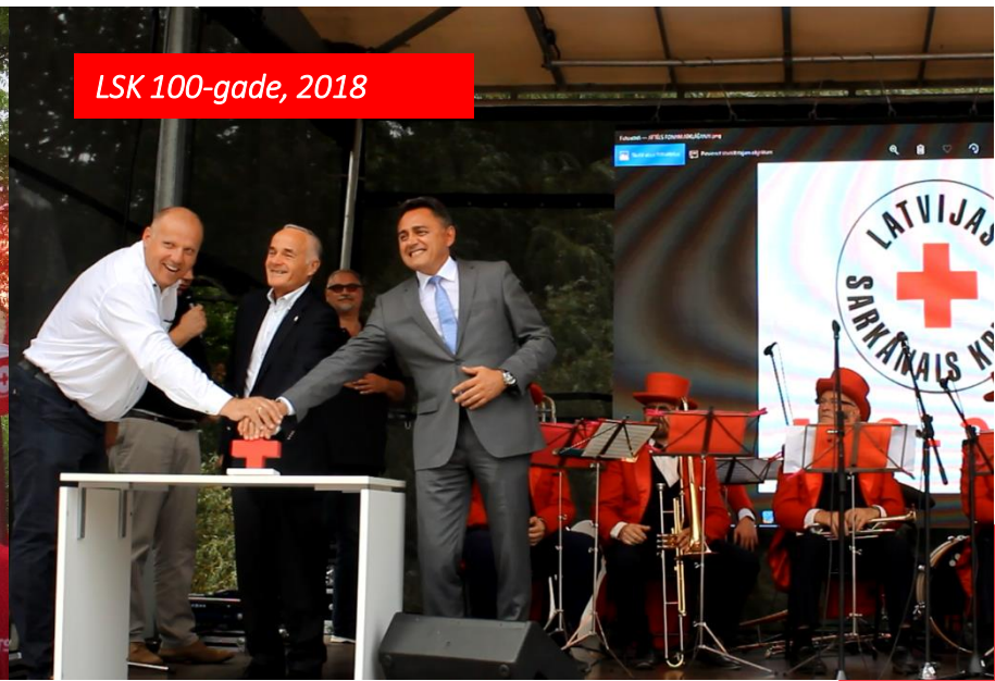
LSK 100-gade, 2018