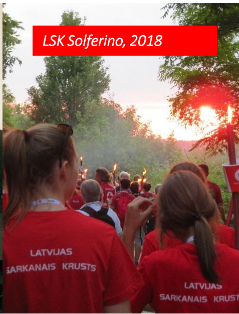
LSK Solferino, 2018