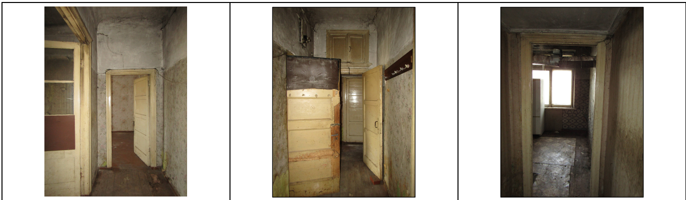
Skats uz gaiteni