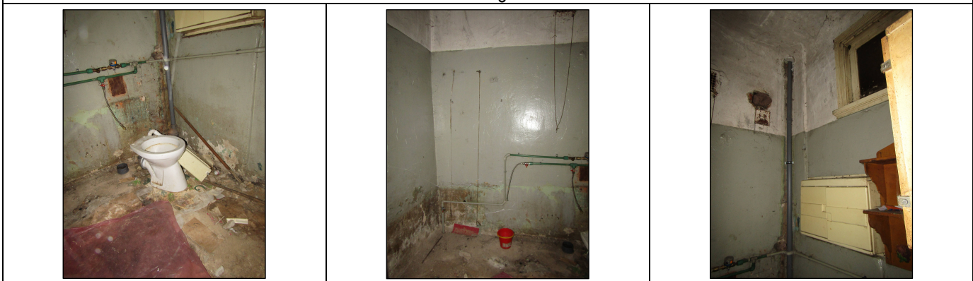
Skats uz vannas istabu un tualeti