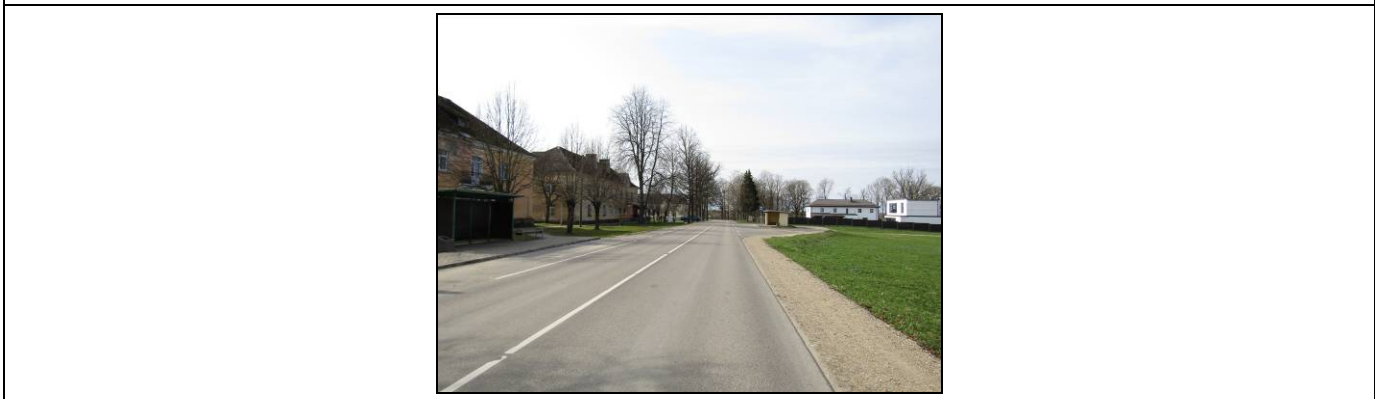
Skats uz dzīvojamo māju, Valmieras ielu