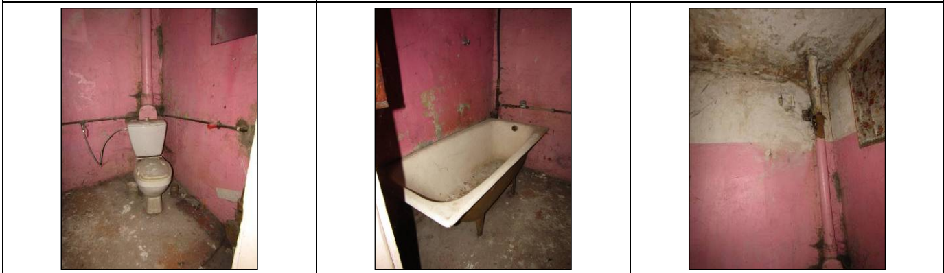
Skats uz vannas istabu un tualeti