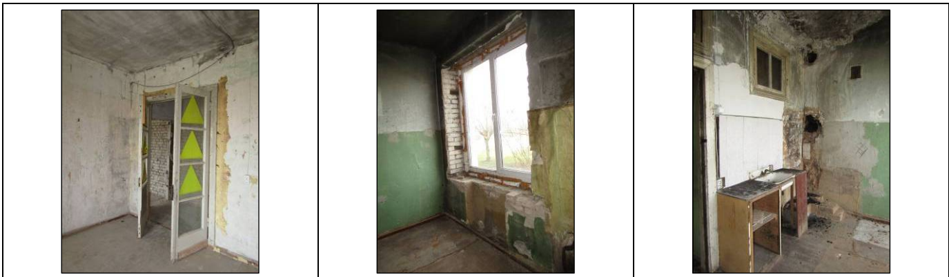
Skats uz istabu