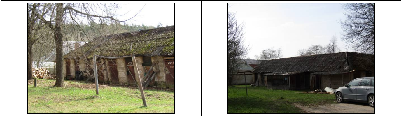
Skats uz palīgēku