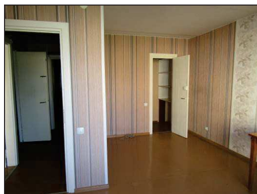
Skats uz istabu