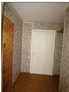
Skats uz gaiteni