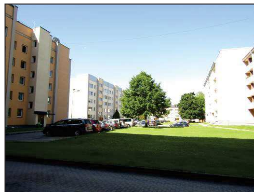
Skats uz pagalmu