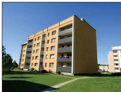
Skats uz dzīvojamo ēku