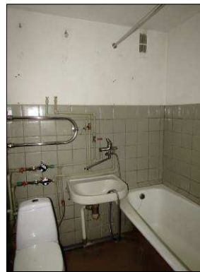
Skats uz sanmezglu