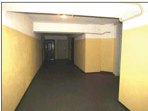
Skats uz koplietošanas gaiteni