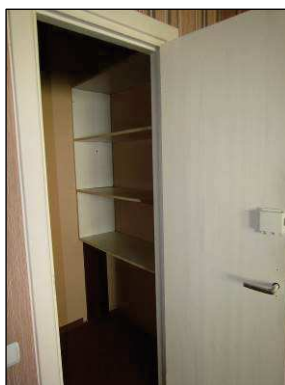
Skats uz pieliekamo