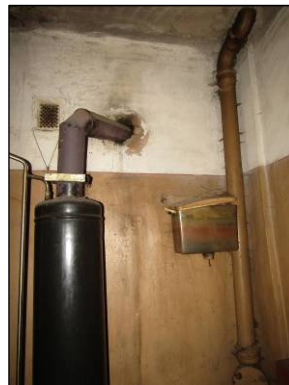
Skats uz vannas istabu un tualeti