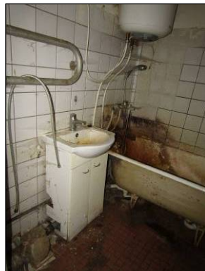
Skats uz vannas istabu