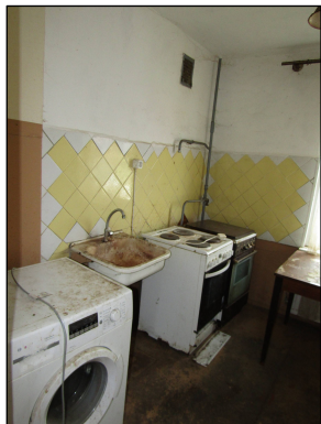
Skats uz virtuvi