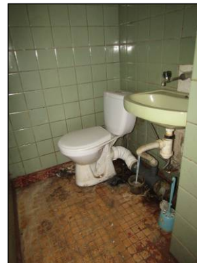
Skats uz tualeti