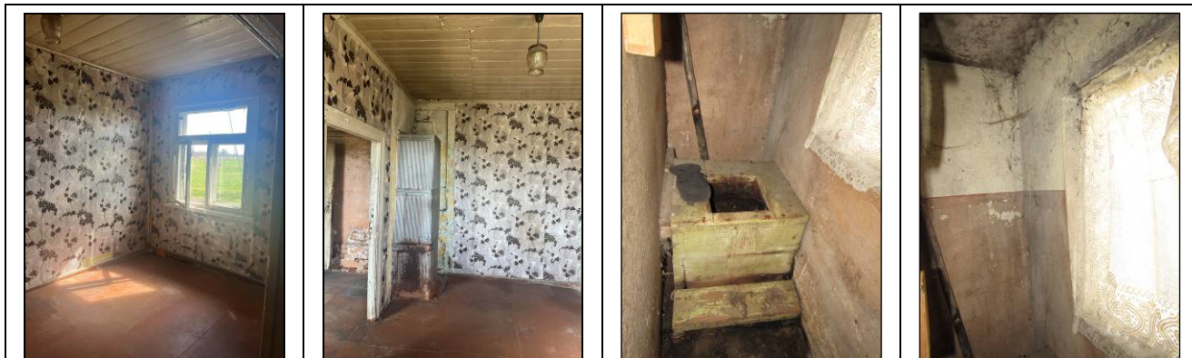
Skats uz istabu