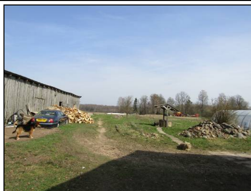
Skats uz šķūni, iebraucamo ceļu