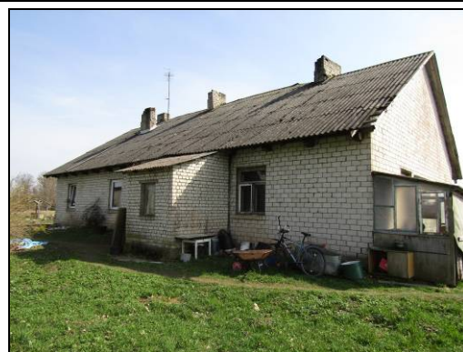
Skats uz dzīvojamo māju