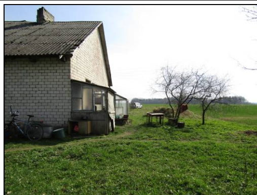
Skats uz pagalmu, zemi pie apbūves