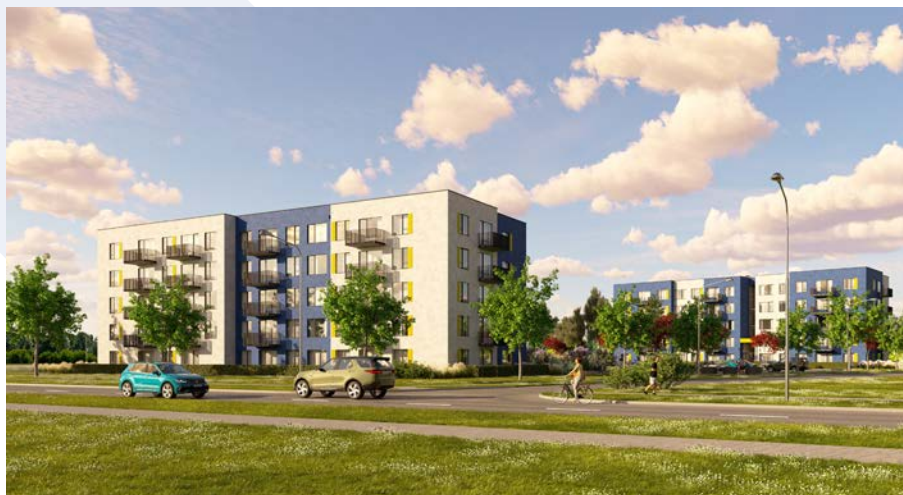
Zemas īres maksas dzīvojamo māju vizualizācija.

Edīte Stērste, Valmieras novada pašvaldība