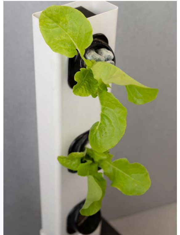
Hidroponiskā sistēma.

Atbalsta programmā “Vidzemes inovāciju programma studentiem” radītais un reģistrētais SIA “Hydrosprout” ir automatizētu, kompakto un modulu hidroponisku sistēmu veidotāji. Ar uzņēmējdarbības programmas “ZĪLE 2023” atbalstu SIA “Hydrosprout” guva iespēju paplašināt produktu klāstu, izstrādājot vertikālu hidroponisku sistēmu, un veicināja uzņēmuma atpazīstamību gan Valmieras novadā, gan citviet Latvijā.