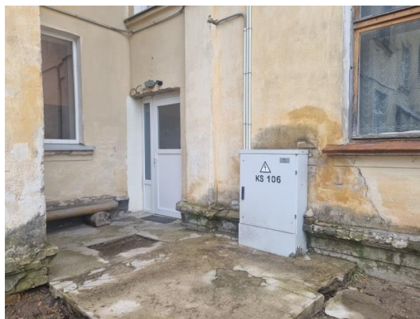
Daudzdzīvokļu mājas ārskati