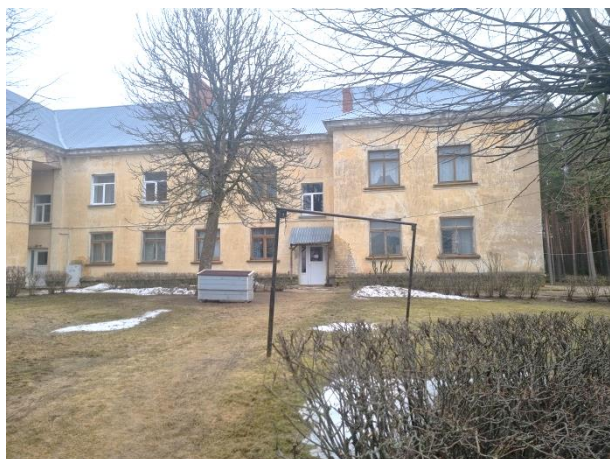
Daudzdzīvokļu mājas ārskati