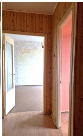
Dzīvokļa ieejas durvis