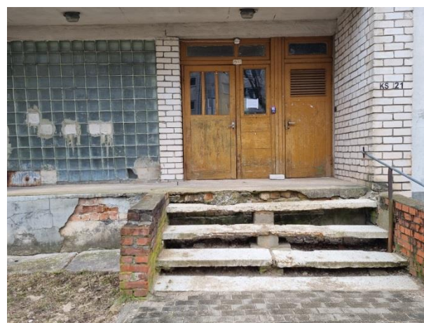
Daudzdzīvokļu mājas ārskati