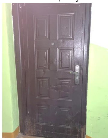
Dzīvokļa ieejas durvis