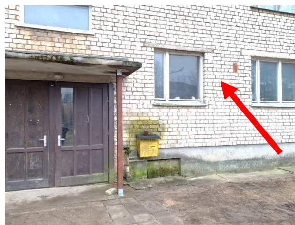
Daudzdzīvokļu mājas ārskati