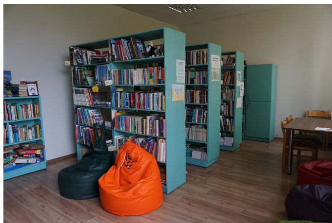
Rencēnu pamatskolas bibliotēka ir iecienīta vieta, kur skolēni pavada savu brīvo laiku.

Mācību gada noslēgums skolā ir ļoti rosīgs, 9. klašu skolēni kārtā eksāmenus, bet pārējie skolēni steidz gada laikā uzkrātās zināšanas likt lietā noslēguma kontroldarbos. Tāpat tuvojas tas brīdis, kad pateicībā par mācību gada laikā iegūtajiem