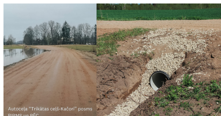
Autoceļa "Trikātas ceļš-Kačori" posmā PIRMS un PĒC

Autoceļa "Trikātas ceļš-Kačori" posmā pavasara/rudens lietavās pārmitrinājās ceļa segums un šo posmu bija apgrūtināši izbraukt. Veikta caurtekas nomaiņa, sakārtojot ūdens atvadi no autoceļa un uzlabojot tā caurbraucamību.