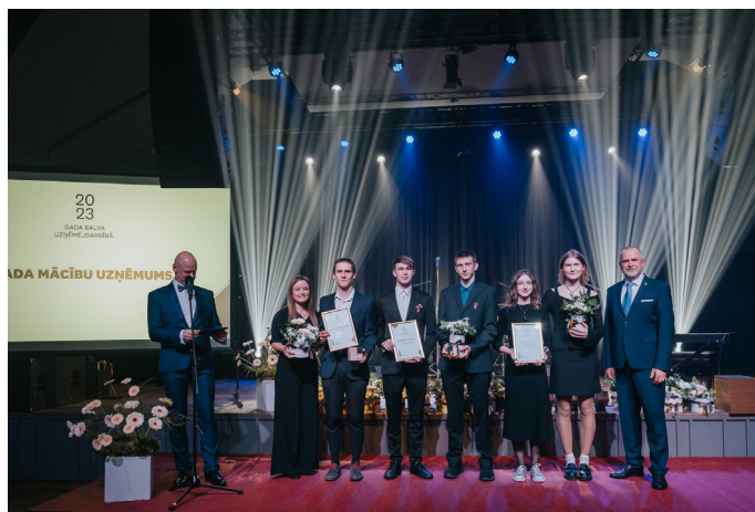
Valmieras novada gada balva uzņēmējdarbībā 2023” nominācijas “Gada mācību uzņēmums” apbalvojumu saņēmēji.

Skolēnu mācību uzņēmumu programma ir būtisks solis jauno uzņēmēju sagatavošanā, sniedzot iespēju praktiski izprast uzņēmējdarbības pamatus jau agrīnā vecumā. Šāda programma ir svarīgs instruments ne tikai praktisko prasību veidošanā, bet arī ilgtermiņa attieksmes un vērtību veidošanā jaunajā paaudzē, kas nākotnē var būtiski ietekmēt uzņēmējdarbības attīstību un inovācijas. Pedagogu atbalstam un zināšanām ir būtiska loma izglītojamo iesaistē, lai izveidotu veiksmīgus skolēnu mācību uzņēmumus. Īpaši vēlamies izcelt Valmieras tehnikumu un Valmieras Dizaina un mākslas vidusskolu, kuru audzēkņu radītie uzņēmumi tiek pamanīti un atzinīgi novērtēti.