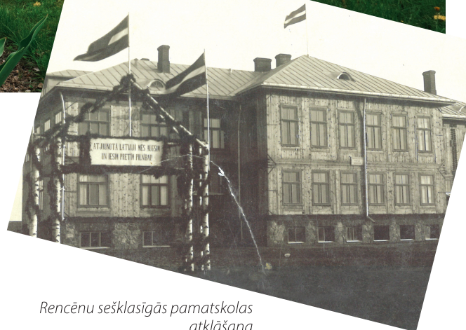
Rencēnu sešklasīgās pamatskolas atklāšana

No 1996. gada svinīgos brīžos līdzās Latvijas karogam klātesošs ir skolas karogs ar tajā ieauštiem zināšanu simboliem – pūci un grāmatu. Karoga metu darināja ģeogrāfijas sko-