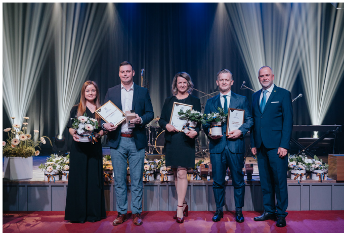
“Valmieras novada gada balva uzņēmējdarbībā 2023” nominācijas “Gada sadarbība ar izglītības iestādēm” apbalvojumu saņēmēji.

Uzņēmumu sadarbība ar izglītības iestādēm nodrošina jauniešiem praktiskas mācības un darba pieredzi, kas ir svarīgi viņu profesionālajai izaugsmei. Tiek veicināta mācību programmu attīstība, lai tās atbilstu industriju prasībām un tehnoloģisko tendencu izmaiņām. Uzņēmumu un izglītības iestāžu sadarbībā top pētniecības projekti, attīstot jaunas tehnoloģijas un risinājumus, veicinot zinātnisko progresu un inovācijas.