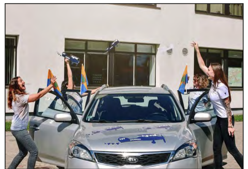
Izrotā savu pārvietošanās līdzekli un nofotogrāfējies goda vārtos pie Valmieras Kultūras centra!

• aicinām izvērtēt savu veselības stāvokli un nepiedalīties braucienā, ja ir elpceļu infekcijas slimības simptomi, kā arī ja ir noteikts pienākums ievērot pašizolāciju, mājas karantīnu vai stingras izolācijas nosacījumus.