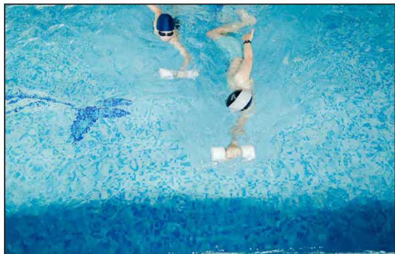
Valmieras peldbaseins atsācis darbu pēc pārtraukuma!

Ūdens priekus Valmierā var baudīt droši!