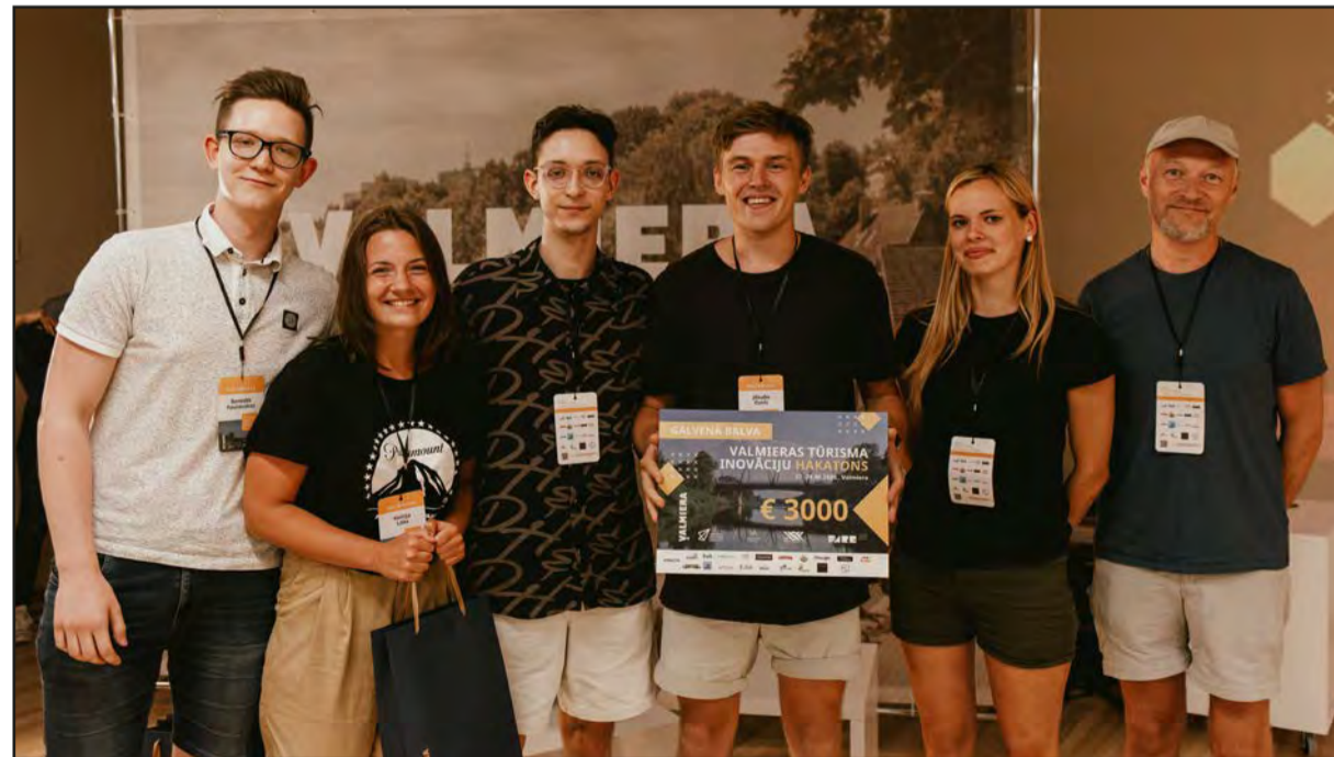
Pateicamies par dalību un vērtīgajām idejām Valmieras tūrisma attīstībai!

Hakatonu rīkoja Valmieras pilsētas pašvaldība, Valmieras Attīstības aģentūra, Valmieras Tūrisma informācijas centrs, Vidzemes Augstskola un Vidzemes Olimpiskais centrs. Atbalstītāji: White label, Neonija, Vidzemes plānošanas reģions, SIA "VALPRO", "Valmiermuižas alus" darītava, Kokmuiža, Gardu muti, Gaujas Stāvo krastu Sajūtu parks, Valmieras peldbaseins, Piedzīvojumu spēle "Timemachine", Sniega tehnika, SIA "Naukšēni, Bolt, Red Bull, airēšanas klubs "Straume", Food Union, Valmieras piens, WVR, Medus kāre, Kafē serviss.