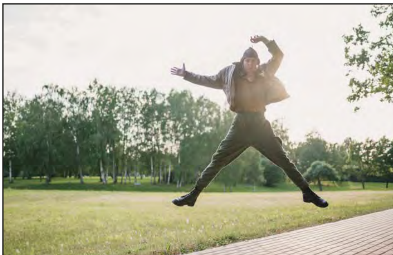
Gaidīsim radošas un atraktīvas pacelšanās fotogrāfijas!

Fotogrāfijas vērtēs īpaša žūrija, kā arī interesantākās bildes publicēs Valmieras Facebook lapā un apskatīsim dzimšanas dienas tiešraidē laikā, 25.jūlijā, kanālā ReTV, www.valmiera.lv un Valmieras Facebook lapā.