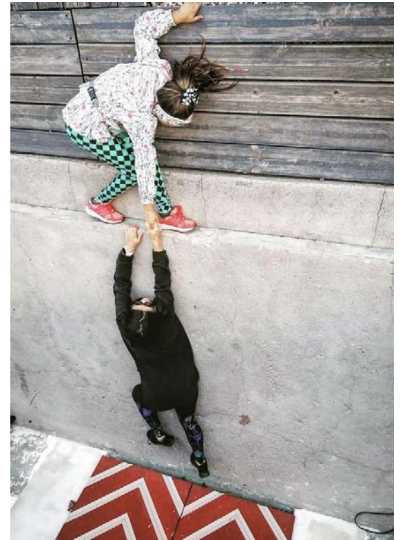
Lai sajūtām un piedzīvojumiem bagāta dzīve jaunajā Valmieras novadā. Lai top!