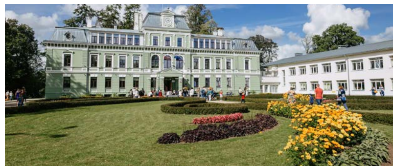
Aicinām uz svētkiem Kokmuižā!

Informācija tirgotājiem: Inese Bērziņa, tālrunis 26328943 , e-pasts inese.berzina@kocenunovads.lv .