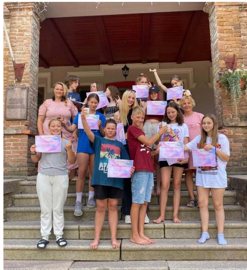
Jauniešu pašizaugsmes treniņa nometne Jeros

15. jūlijā Valmieras novadā tika apstiprināts nolikums, aicinot iestādes, organizācijas var pieteikties, lai augustā organizētu bērniem un jauniešiem dienas nometnes. Projektā plānots piedāvāt nometnes 52 Rūjienas bērniem, plašāka informācija būs pieejama www.valmierasnovads.lv , kur varēs iepazīties ar nolikumu, bet par nometņu aktivitātēm uzzināsi, tiklīdz būs saskaņotas programmas. Sekojiet līdz informācijai Rūjienas jauniešu centra un Valmieras novada Facebook lapā, informēta tiks arī Rūjienas vidusskolas vecāku dome, kas nodos informāciju tālāk vecāku grupām. Plānotais nometņu norisē laiks no 9. līdz 13. augustam un no 16. līdz 20. augustam. Lai jauka vasara!