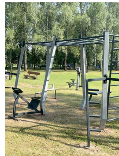
Jaunie rotaļu laukuma elementi Parka ielā Mazsalacā

Arī publiskajā rotaļu laukumā pie Mazsalacas pilsētas pirmsskolas izglītības iestādes ir jauni rotaļu laukuma elementi. Rotaļu laukums ir brīvi pieejams apmeklētājiem katru dienu, kad nenotiek pirmsskolas izglītības iestādes audzēkņu nodarbības. Rotaļu laukuma apmeklēšana un izmantošana ir bezmaksas un laukuma iekārtas paredzētas bērniem līdz septiņiem gadiem. Par bērnu veselību, drošību un atrašanos rotaļu laukumā atbild vecāki, to pilnvarotā persona vai aizbildņi.