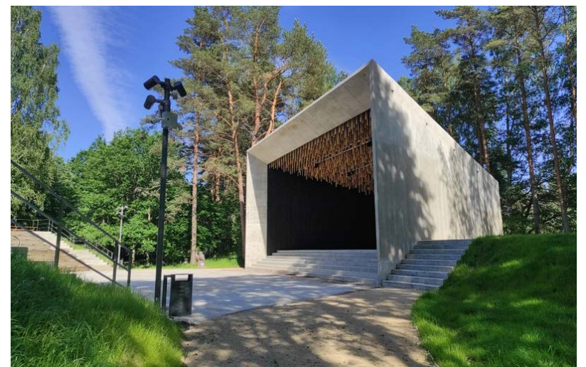
Strenču brīvdabas estrāde

Atbalsta Zemkopības ministrija un Lauku atbalsta dienests