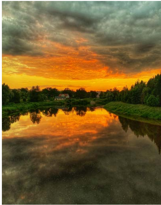
Savu pirmo dienu Valmieras novadā sagaidīju uz Vanšu tilta, kur Gaujas upes atspulgā vēroju krāšņu saulrietu, tas nozīmē, ka, ja pirmajā dienā ir bijis tik skaists saulriets, tad Valmieras novads plauks un zels. Lai viss izdodas Valmieras novadam!

Par balvu saņemšanu sazināsimies ar to ieguvējiem personīgi.