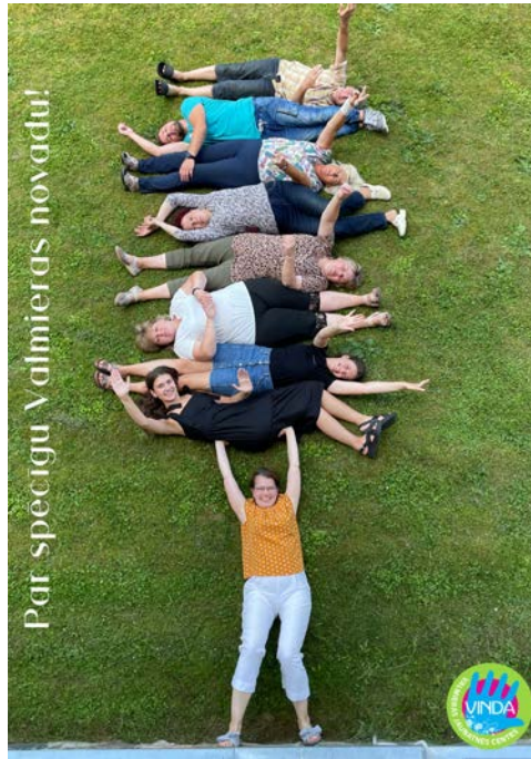
Jaunatnes centrs “Vinda” ar jaunu spēku, enerģiju un radošumu ir gatavs turpināt darbu jaunajā Valmieras novadā! Novēlam Valmieras novadam jaunu spēku visās jomās! Foto iesūtīja Valmieras Jaunatnes centrs “Vinda”