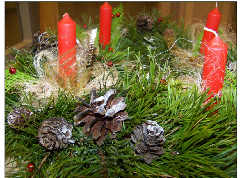
Lai skaists Ziemassvētku gaidīšanas laiks!

meža veltēm – klūgām, čiekuriem, sūnām un citiem dabas materiāliem. Darbam noderēs līdzpaņemtās klūgas, sausi čiekuri, kastaņi, kaltētas apelsīnu šķēlītes, kanēļa standziņas, žāvētas ķirbju mizas un sēklas, bērza tāsīs vai kādi citi dabas materiāli. Košumam izmantosim arī krāsainas pērles, dzijas, lentītes. Ieeja bez maksas.