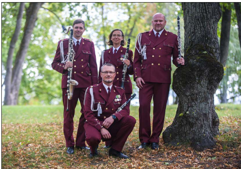
NBS klarnēšu kvartets "Quattro Differente"

Koncertus vadīs Gatis Supe. Ieeja bez maksas. Koncertus atbalsta Latvijas Nacionālā bibliotēka, Lietuvas armijas orķestris, NBS Štāba orķestris, NBS Štāba bataljons, Rīgas Motormuzejs, Latvijas Radio 3 Klasika, Saldus Mūzikas un mākslas skola, Valmieras Kultūras centrs un Gaismas pils restorāns "Kliversala".