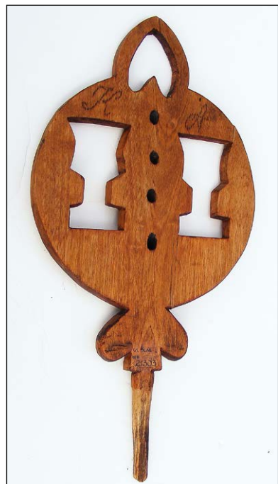
Kodeļas turētājs – stiprināms pie ratiņa