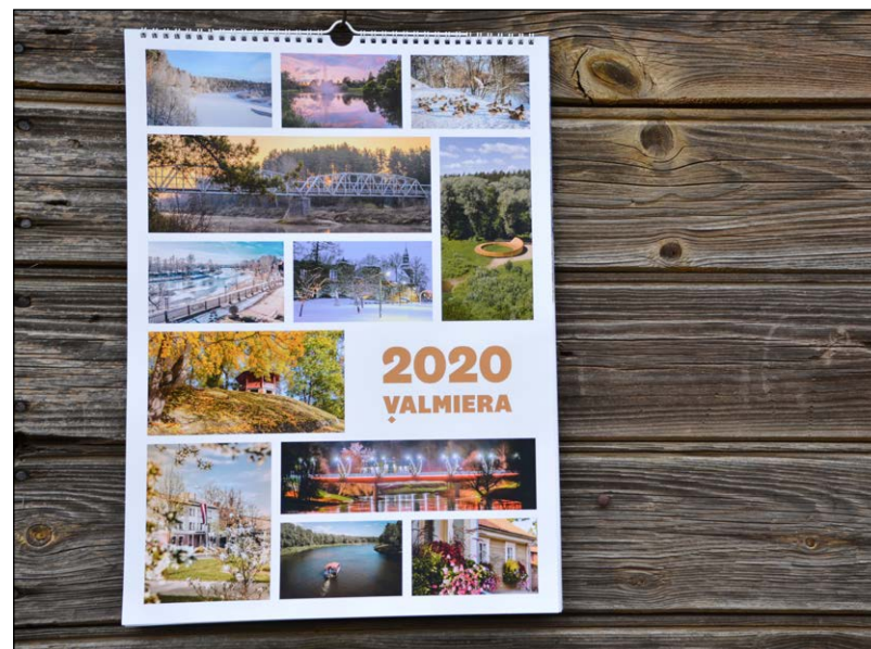
Valmieras 2020. gada sienas kalendārs ir noderīgs un praktisks palīgs jaunajam gadam

Jāpiemin, ka novembra beigās Valmieras Tūrisma informācijas centrā būs pieejams arī Valmieras plānotais 2020. gadam. Aicinām sekot līdzi informācijai visit.valmiera.lv .