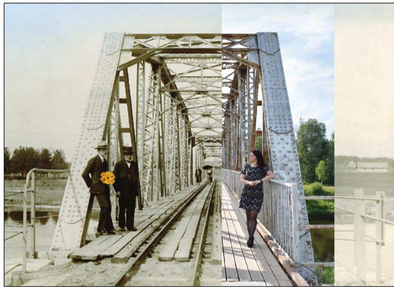
Tūrisma akcijā uzzini, kā laika gaitā mainījušās vēsturiskas un nostāstiem apvītas vietas Valmierā un apkārtnē novados

Akcijas bukletu meklējiet Valmieras TIC (Rīgas ielā 10), Valmieras pilsētas pārstāvniecībā Rīgā (11. novembra krastmala 29), tirdzniecības centrā “Valleta”, kā arī citos tūrisma informācijas punktos Valmierā un apkārtnē novados. Ar akcijas noteikumiem var iepazīties www.visit.valmiera.lv .