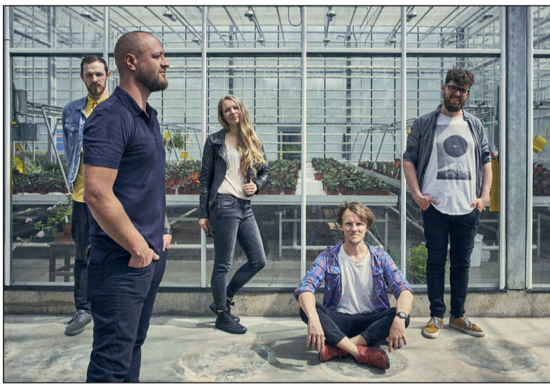
Grupa "The Sound Poets" Valmieras pilsētas svētkos priecēs ar savu labāko dziesmu koncertprogrammu