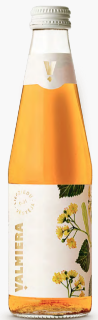
Valmieras pilsētas svētkos tiks prezentēts Valmiermuižas alus darītavas garškopju veltījums Valmierai