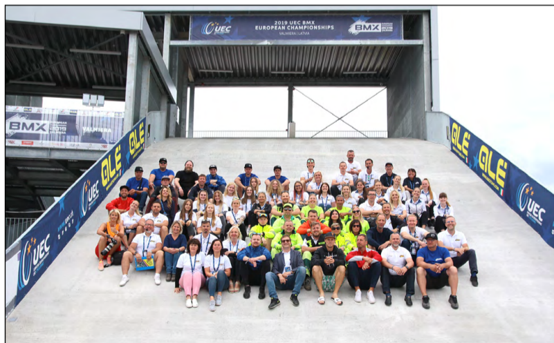
Pirmās starptautiskās BMX sacensības jaunajā trasē aizvadītas godam