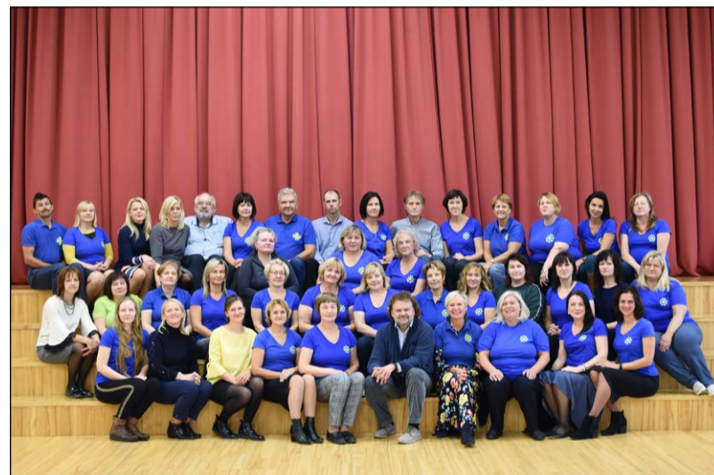
Sveicam kori "Valmiera" skaistajā jubilejā, lai skan balsis un dziesma!

Kā jau kārtīgam pašdarbības kolektīvam pienākas, kora dalībnieki ir ļoti saliedēti, un kopā pieredzēti tik daudz skaistu notikumu, piedzīvojumu un kuriozu. Diriģents atklāj, ka viņam viens no patīkamākajiem no-