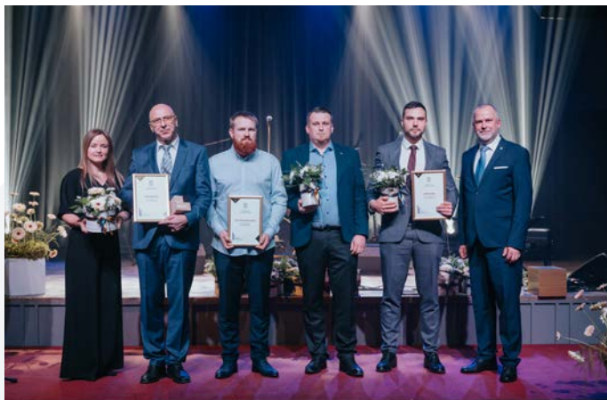
“Valmieras novada gada balva uzņēmējdarbībā 2023” nominācijas “Gada saimnieks” apbalvojumu saņēmēji.

Ģimenes saimniecība “Zemturi” atrodas Burtņieku pagastā, tā nodarbojas ar piena lopkopību un tiešo piena tirdzniecību, kā arī ar zaļās enerģijas ražošanu no biogāzes. 30 gadu darbības laikā saimniecība no vienas gotiņas un 10 ha zemes ir izaugusi līdz 200 slaucamām govīm, vairāk nekā 250 ataudzējamiem liellopiem un 510 ha apsaimniekojamās zemes. Saimniecībā ir biogāzes stacija, kas ļauj nodrošināt bezatlikumu tehnoloģiju un attīstīt pašu zīmolu – “Zemturu svaigpiens”.