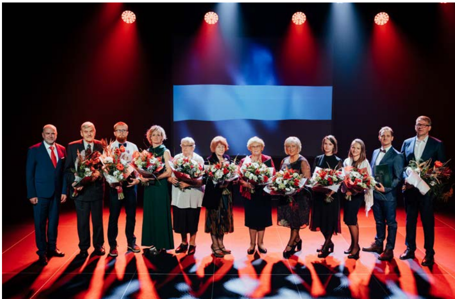
Apbalvojumu "Valmieras novada Goda pilsonis" un "Valmieras novada Gada cilvēks" saņēmēji 2024. gadā.

Šajā un turpmākajos Valmieras novada pašvaldības informatīvā izdevuma numuros iepazīstināsim ar katra apbalvojuma saņēmēja īpašo stāstu.