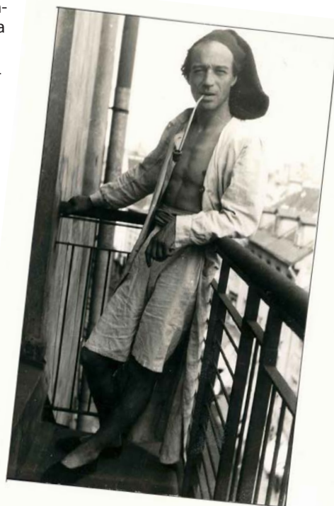
Uz darbnīcas balkona Rīgā, Mārstaļu ielā 1. 1925.