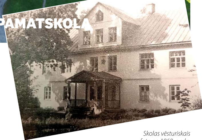
Skolas vēsturiskais foto no 1960. gada.