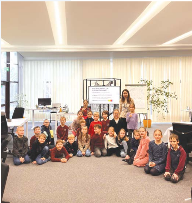
Ilustratīvs foto no nodarbības “Pasakas dizains”.