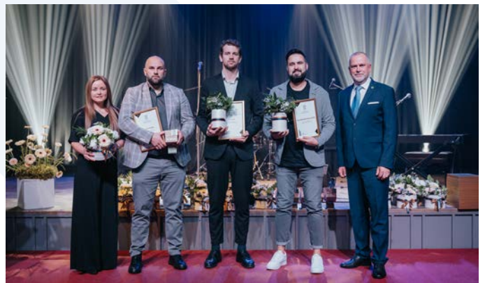
“Valmieras novada gada balva uzņēmējdarbībā 2023” nominācijas “Gada jaunuzņēmums” apbalvojumu saņēmēji.