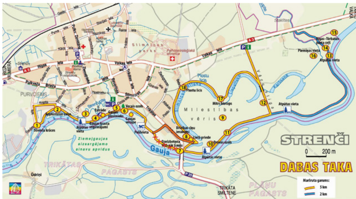
Karte, kurā iezīmēts alternatīvais ceļš (oranžais posms)

Šobrīd ir uzsākti dzelzsbetona tilta pārbūves darbi, kas ilgs līdz pat nākamā gada rudenim. Tā kā tilts sadala taku divās daļās, takā uzstādītas norādes zīmes par alternatīvo ceļu, lai apietu būvdarbu vietu.