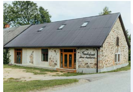
Naukšēnu vīna darītava.

SIA “Bauņu sēta” jeb “Naukšēnu vīna darītava” nodarbojas ar lauksaimniecību un raudzēto dzērienu ražošanu no 2012. gada. Ar “ZĪLE 2023” atbalstu uzņēmums vēlējas attīstīt un virzīt realizācijai tirgū jaunu dzērienu segmentu. Konkurss tika iegūts daļējs finansiāls atbalsts idejas īstenošanai, kas ieguldīts etiķešu dizaina izstrādē.