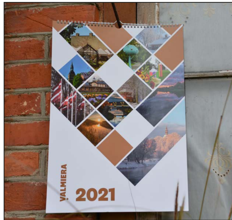
Liene Pinne, Valmieras pilsētas pašvaldība

Pieejams Valmieras sienas kalendārs 2021.gadam, ko iespējams apskatīt un iegādāties Valmieras Tūrisma informācijas centrā Rīgas ielā 10. Kalendāra cena – 4,00 EUR.