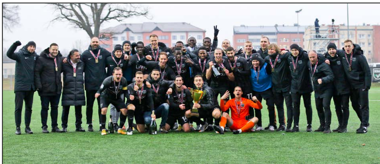
Sveicam un lepojāmies!