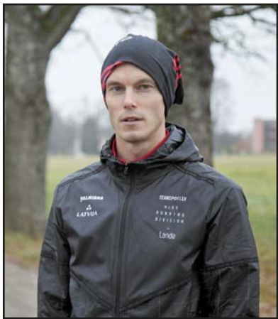
Vidzemes Olimpiskais centrs

Arnis Rumbenieks ir Valmierā dzimis vieglatlēts, soļotājs, kurš pārstāvējis Latviju 2012.gada vasaras olimpiskajās spēlēs Londonā un 2016.gada olimpiskajās spēlēs Riodežaneiro. Nesen sacensībās Ukrainā sportists labojis savu personīgo rekordu 50 kilometru soļošanā, lietainos un drēgnos laikapstākļos finišējot pēc trim stundām 55 minūtēm un 27 sekundēm. Bijis saistīts ar Valmieras sporta vidi, tad vairāk nekā 10 gadus pavadījis prombūtnē, bet tagad atgriezies Valmierā. Sarunas laikā olimpietis A.Rumbenieks pastāstīja vairāk par saviem plāniem un atgriešanos.