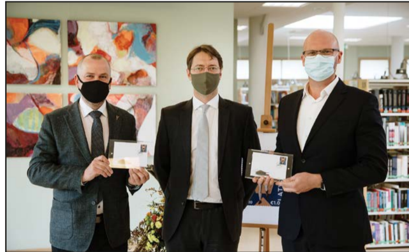
Pasniegti Jāņa Daliņa pastmarkas pirmie goda eksemplāri

Jānis Daliņš ir ievērojams latviešu sportists – viens no visu laiku izcilākajiem latviešu vieglatlētiem. Savas profesionālās karjeras laikā uzvarējis daudzās soļošanas sacensībās Latvijas un pasaules mērogā. 1932.gadā Amerikas Savienotajās Valstīs, Losandželosā risinājās X olimpiskās spēles, kurās slavenais sportists izcīnīja sudraba medaļu 50 km soļojumā, iegūstot pirmo olimpisko medaļu Latvijas sporta vēsturē.