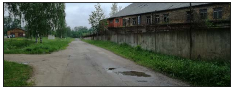
Drīzumā Dzelzceļa ielu gaida pārmaiņas