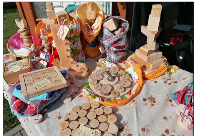
Jauniešu gatavotie darinājumi rudens tirdziņā

Pateicoties Sabiedrības integrācijas fonda nevalstisko organizāciju programmas atbalstam, fonda "Iespēju tilts" jaunieši ar GRT sadarbibā ar Valmieras novada fondu apmeklēja dažādas vietas, piedalās pasākumos un aktivitātēs, integrējoties sabiedrībā. Iekļaujošo aktivitāšu mērķis ir veicināt sabiedrības uzskatu maiņu par cilvēkiem ar GRT, to moto – cilvēks, nevis diagnoze!