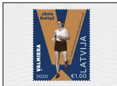
Jānim Daliņam veltītās pastmarkas vizualizācija