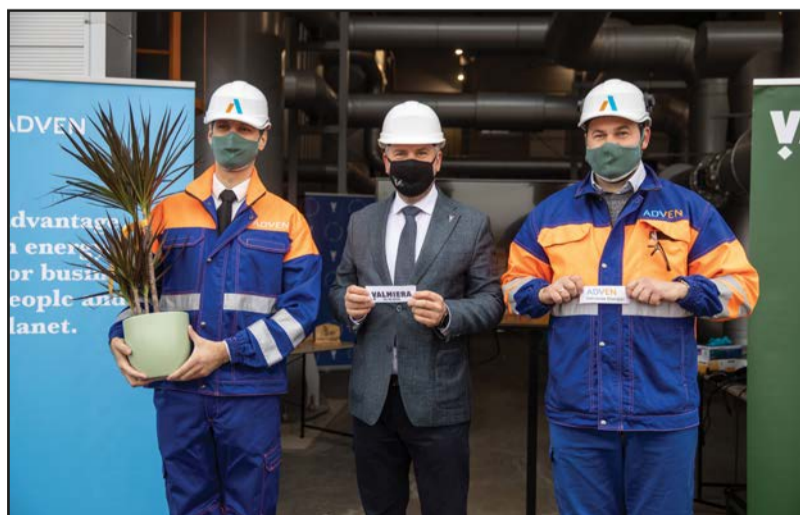
Jaunā katlu māja ļaus ilgtermiņā nodrošināt stabilāku siltumenerģijas ražošanas tarifu