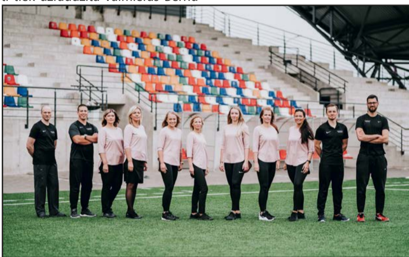
Sporto un esi vesels!

Plašāka informācija par Sporta Veselības centrā piedāvātajiem pakalpojumiem pieejama mājaslapā www.sportaveselibascentrs.lv .