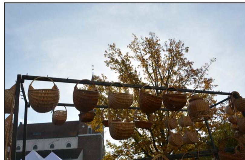
Rudens veltes sirdij un vēderam pašā Valmieras centrā

gadatirgu atkal iepazīna, sākot no 1996.gada, kad Valmieras muzejs, godinot tradīcijas un tautas amata prasmes, atjaunoja vēsturisko Simjūda gadatirgu. Šogad tirgus atkal "jaunās skaņās" ievērojot pašreizējo epidemioloģisko situāciju, tirgus būs mazākā apjomā, bet, kā senākos laikos, to būs iespējams apmeklēt pat divas dienas.