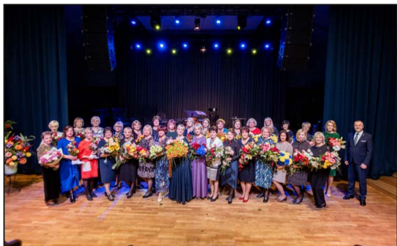
Sveicam un lepojamies!

Zane Bulmeistere, Valmieras pilsētas pašvaldība