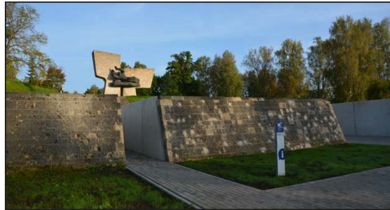
Memoriāls ir atdusas vieta vairāk nekā 500 karavīriem un vairāk nekā 300 civilpersonām, kuras pārāpbedītas no 13 apbedījumu vietām un kapsētām Valmierā un Valmieras apriņķī

2018.gadā ar mērķi konstatēt galvenos bojājumus, to iemeslus un rekomendēt nepieciešamos darbus tika veikta objekta tehniskā apsekošana. Bojājumi radušies