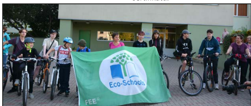
Ekoskolu jaunieši apņēmības pilni darboties

Ekoskolu programmā Latvijā šobrīd darbojas aptuveni 200 izglītības iestādes (no pirmsskolām līdz pat augstskolām), bet visā pasaulē programmā ir iesaistītas 59000 izglītības iestādes 68 valstīs. Programmā tiek aicināta piedalīties ikviena izglītības iestāde, kas gata savā darbā ilgtermiņā pievērsties vides aizsardzības un ilgtspējīgas attīstības jautājumiem. Šogad Latvijā starptautisko Zaļo karogu saņēma 110 izglītības iestādes. 52 iestādes ieguva Latvijas Ekoskolas sertifikātu.