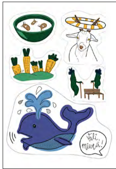
Autore Nikola Drēviņa (kvalifikācijas darba vadītāja Krista Jūlija Kreišmane)