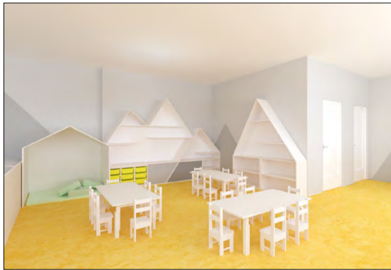
Autore Elina Žuravļeva “PIL “Varavīksne” grupas telpas interjera dizains” (kvalifikācijas darba vadītāja Vizma Auzenberga-Kalniņa)

Jāpiemin, ka līdz 15. jūlijam notiek uzņemšana VDMV profesionālās vidējās izglītības programmās – Interjera dizains, Apģērbu dizains, Reklāmas dizains, Multimediju dizains.