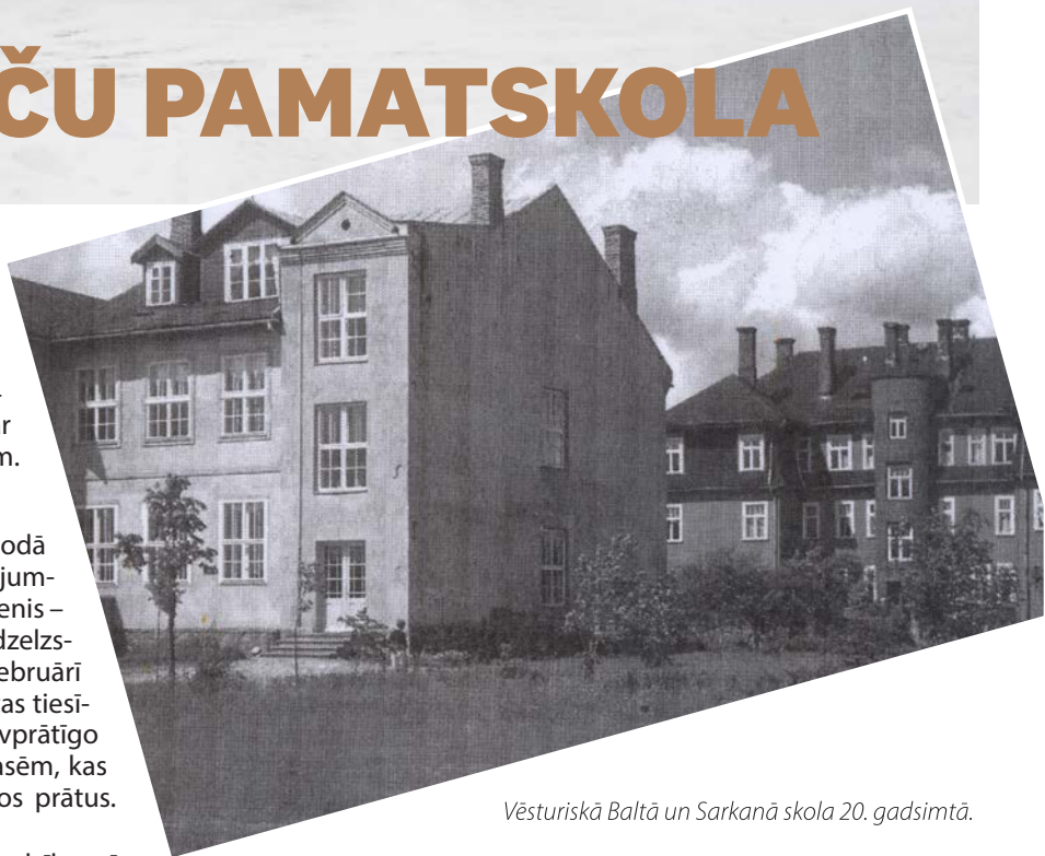
Vēsturiskā Baltā un Sarkanā skola 20. gadsimtā.

Izglītība Streņčos fiziski un emocionāli pārsvarā ir saistīta ar trim ēkām. Tautā sauktā Baltā skola , kuras liktenis diemžēl ļoti skarbs, tā 1992. gada vasarā nodega. Tagadējā Streņču pamatskola, kas atklāta 1999. gadā, daļēji atrodas uz Baltās skolas pamatiem, kas rada īpašu pietāti pret šeit esošo izglītības vēstures mantojumu. Un Sarkanā skola , kas demontēta salīdzinoši nesen, tās vietā šobrīd izveidota instalācija – bišu strops, bet