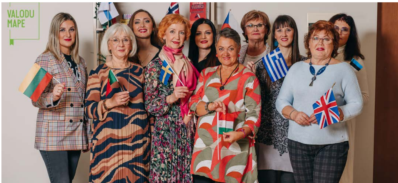
SIA "Valodu Mape" kolektīvs.