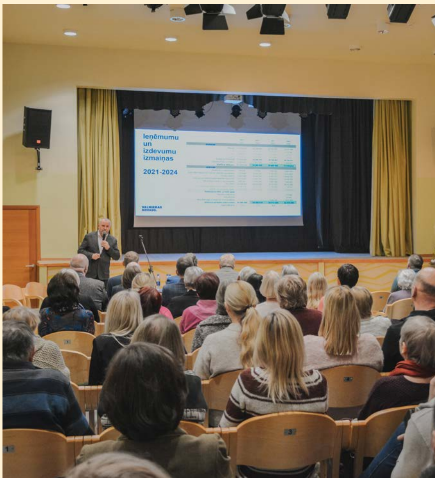
Tikšanās ar iedzīvotājiem Mazsalacā.

Kristīne Melece, Valmieras novada pašvaldība