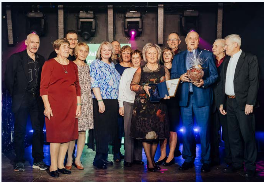
Apbalvojuma "Gada sporta organizācija" saņēmējs - Valmieras Vieglatlētikas klubs