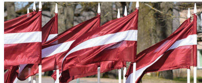
Informāciju sagatavoja: Sabiedrisko attiecību speciāliste Marija Melngārša

Nemot vērā valstī noteiktos ierobežojumus sakarā ar “Covid-19” izplatību, 2020.gada decembra mēnesī publiskie pasākumi nenotiks. Izvērtējot aktuālo situāciju valstī, iespējams var notikt izmaiņas. Lūgums sekot līdzī aktuālajai informācijai!