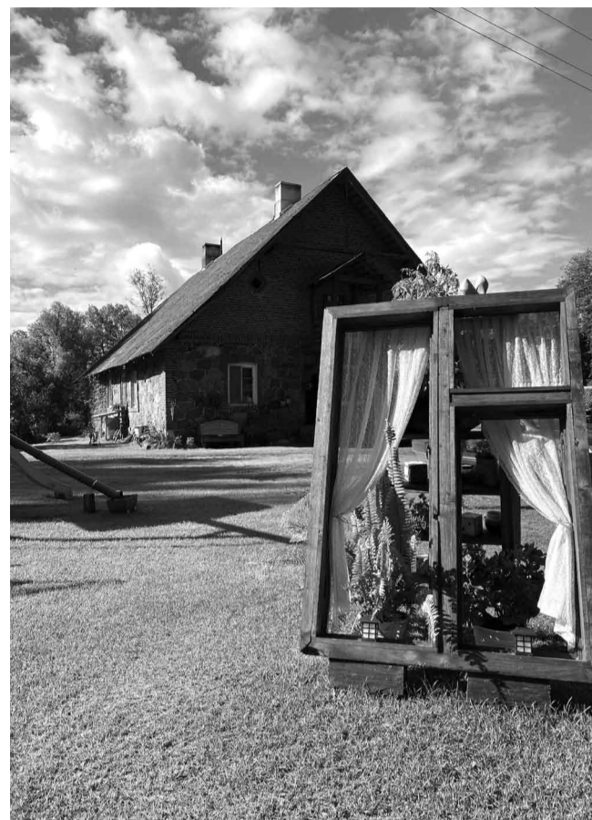
Ģimeņu māja ciemā “Saulrieti-2”, Brenģuļu ciemā, Brenģuļu pagastā

Šis ir īpašums, kas saņēma žūrijas speciālbalvu. Šo īpašumu raksturo vārdi “Māja ar auru – originalitātes pārsteigums”. Īpašnieki prasmīgi ir veidojuši savas sētas teritoriju izmantojot ik vienu brīvo vietu, šī ir iedvesmas sēta, kurā smelties idejas tam, kā realizēt savu redzējumu gan daiļdārzniecības jautājumā, gan saimniekošanā. Krāšņs dārzs ar pārdomātu teritoriju un daudzveidīgu augu kompozīcijām. Pagalma zonu papildina veidots baseins ar ūdens rozēm.