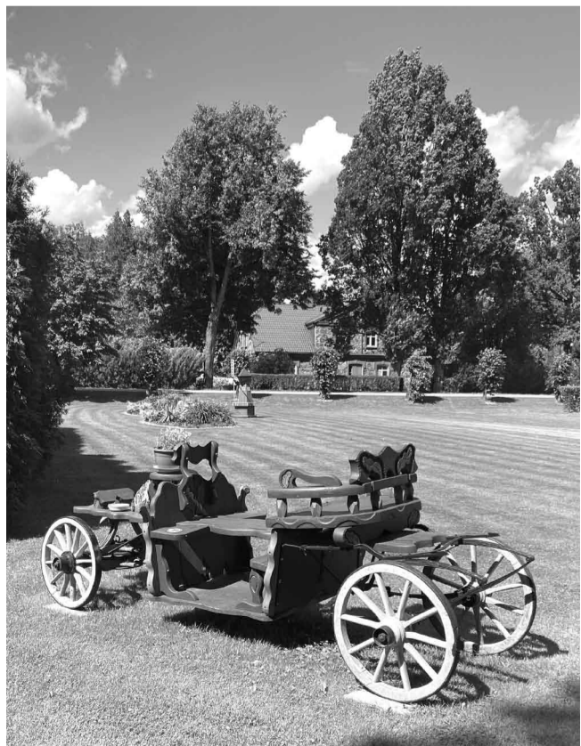
Sakoptākā ģimeņu māja ciemā “Mežāres”, Cempu ciemā, Brenģuļu pagastā

Īpašums 20 gadu garumā ir ieguvis savu formu un dvēseli, kas atspoguļojas ziedu, krūmu un koku kompozīcijās. Pagalmā šogad uzdziedēs puķe “Juka”, kas dziedēs pirmo reizi