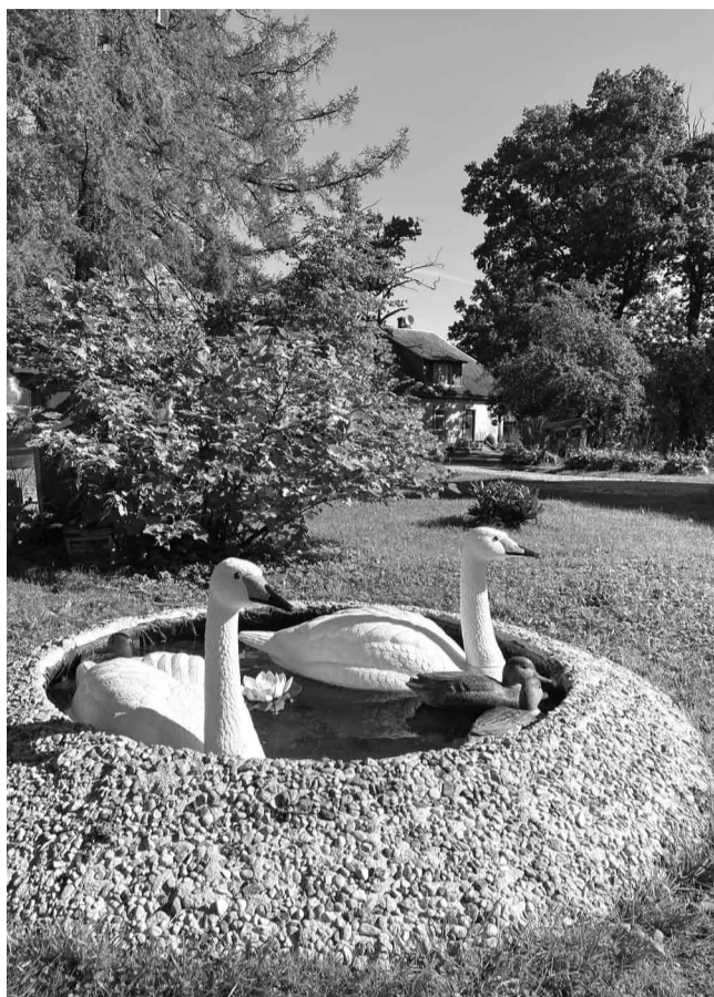
Ģimeņu māja ciemā “Jaunbrenģuļi”, Brenģuļu ciemā, Brenģuļu pagastā

5 gadu laikā. Piemājas teritoriju veido rododendru stādījumi, visdažādākajās krāsās un formās pavasara un vasaras ziedi. Centrālo ieeju veido no liepām veidota arka ar mājas nosaukumu. Dārzu papildina īpašas akmens skulptūras. Viens no pagalmiem, kurā ļoti labi jūtas persika koks. Sēta, kas ar katru gadu paliek ar vien skaistāka. Augot savās daiļdārza aprisēs. Sēta ar plašu teritoriju un labu plānojumu, kas ar dažādiem un krāšņiem augiem veido pagalma zonas. Lauku sētas paradīzes stūrītis – skaisti, pārdomāti, nepārsātināti – radot vieglu un harmonisku pagalma kopskatu.