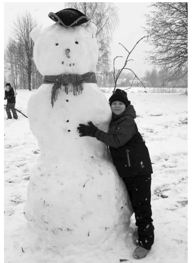
Fotogrāfija no 2021. gada janvāra D. Ciganova ģimenes foto arhīva Informāciju sagatavoja: J. Endzelīna Kauguru pamatskolas sporta skolotāja Mārīte Bisniece

Dzīvosim kustībā paši, rādīsim piemēru un mudināsim to darīt bērns, jo, kā zināms – vārdi māca, bet piemēri aizrauj!