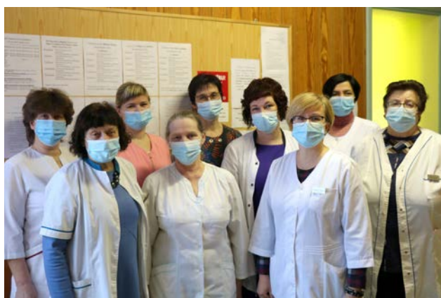
Darbinieki, kuri saņēmuši vakcīnas pret Covid-19, jūtas drošāk veicot savus darba pienākumus

Janvārī vakcīnas pret Covid-19 saņēma arī daļa SIA "Mazsalacas slimnīca" darbinieku.