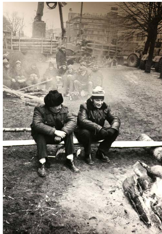
1991. gada barikādes.