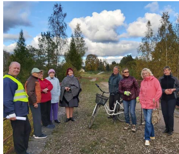
„Mazsalacas dzelzceļa stāsti” 2020. gada 13. oktobrī

Vēl Mazsalacas pilsētas bibliotēkas kolektīvs