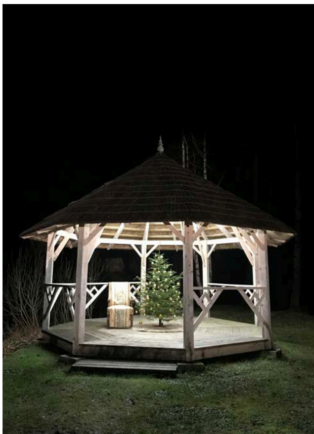
Sēļu muiža un parks gaismu mirdzumā 20.12.2020.

Mazsalacas novada iedzīvotāju saimei decembrī pievienojās pūsisītis