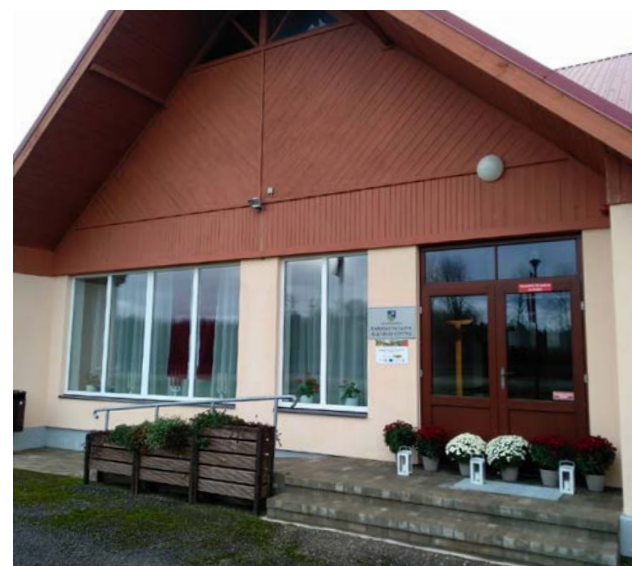
Ramatas pagasta Kultūras centrs