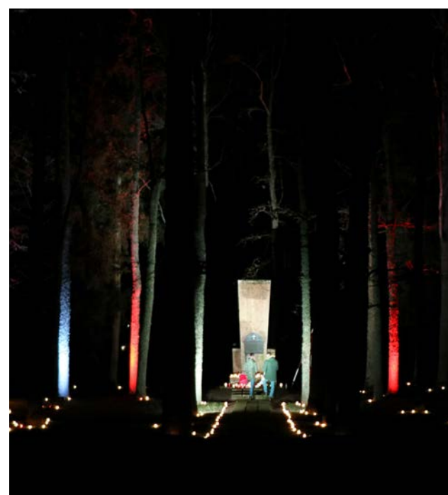
Lāčplēša diena Varoņu birzītē