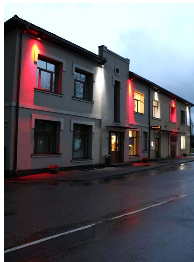
Mazsalacas novada Kultūras centrs

Mazsalacas novada pašvaldības domes priekšsēdētājs