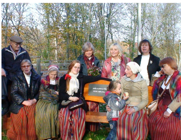
Ansambļa viesošanās Mazsalacā 2019. gada 16. oktobrī

uzvedumā piedalīsies arī Ventspils lībiešu dziesmu ansamblis „Rāndalist”.