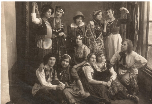
Mazsalacas pašdarbnieki pēc teātra izrādes. Ārgaļa mājā, ap 1915.g.

[...] 29. aprīlī. "Joti arvien nožēloju, ka Tevi Petrogradā nesatiku. Kamdēļ Tu man no Saratovas nerakstīji, ka brauksi uz rotu Petrogradā. Daudz jāstrādā ar fotogrāfijām, maz laika rakstīt. Drīz Tev vēl rakstīšu. Kā ar veselību? Sirsnīgi sveicieni jums abiem no zaldāta. [Jūlijs]"