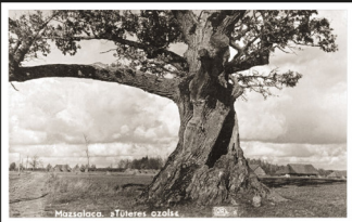
Tūteres ozolu lauza 1967. gada rudens vētra

Fotografēšana caur gadsimtiem būs laika dokumentēšana un vērtības radīšana nākotnei.