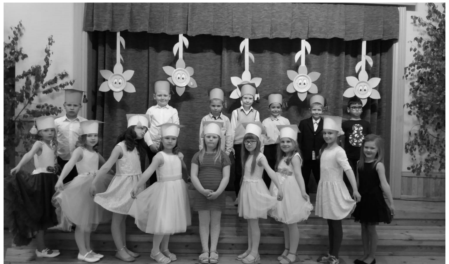
Pirmais izlaidums un pēc dažiem mēnešiem mazie absolventi kļūs par pirmklasniekiem

Bērni un vecāki! Lai saulaina, piedzīvojumiem un emocijām bagāta