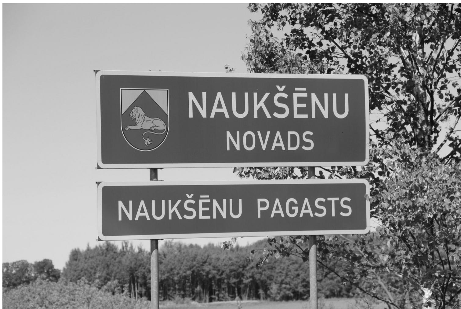
Turpmāk Naukšēnu novada robežzīmi nomainīs Valmieras novads

Tā kā no 2021. gada 1. jūlija Naukšēnu novads beidz pastāvēt, arī tās simbolika paliek vēsturē. Gan novada ģerbonis, gan novada karogs turpmāk