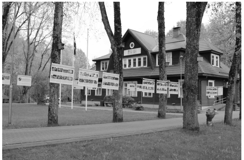
Pie Naukšēnu Doktorāta ikviens aicināts aplūkot to novadu simboliku, no kuriem veidosies jaunais Valmieras novads

valstspilsēta: Valmiera; 4 pilsētas: PMLP). Mazsalaca, Rūjiena, Seda, Strenči; 26 pagasti: Bērzaines, Brenguļu, Burtnieku, Dikļu, Ēveles, Ipiķu, Jeru, Jērcēnu, Kauguru, Kocēnu, Ņoņu, Lodes, Matīšu, Mazsalacas, Naukšēnu, Plāņu, Ramatas, Rencēnu, Sēļu, Skaņkalnes, Trikātas, Vaidavas, Valmieras, Vecates, Vilpulkas, Zilākalna pagasti.