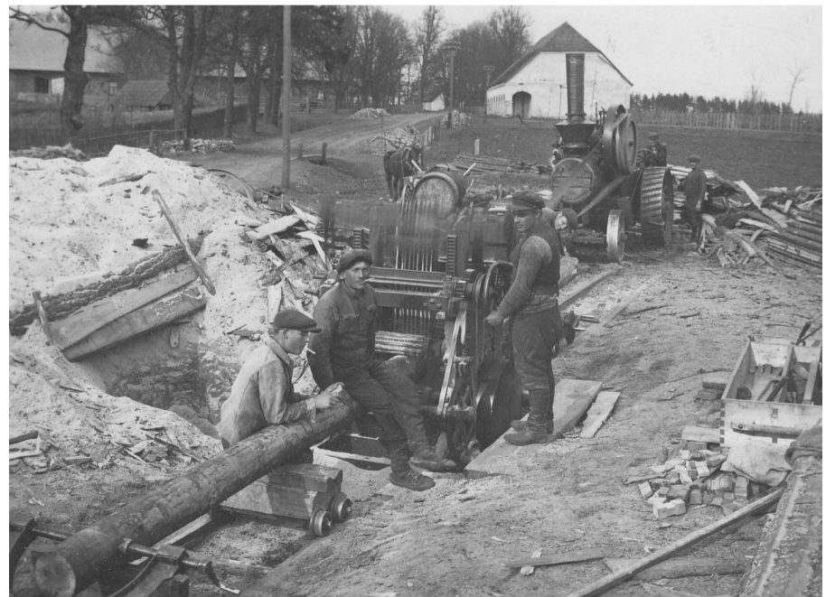
Skats uz Naukšēnu muižas saimniecības ēku un graudu magazīnu. Ap 1935. gadu Naukšēnu centrā bija kokzāģētava.