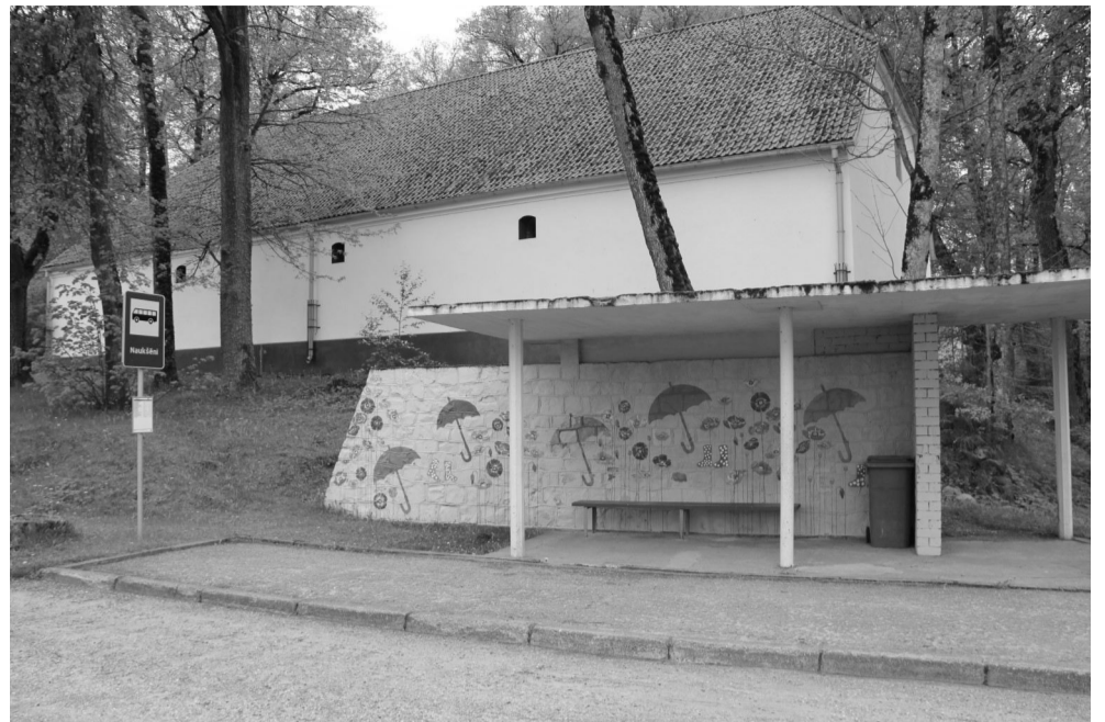
Šajā vasarā Naukšēnu novada vidusskolas Skolēnu parlaments īsteno ideju “Māksla—pietura Jums!”, kas paredz, autobusu pieturas pārkrāsošanu Naukšēnu centrā

Teksts un foto Nora Kārklīņa Sabiedrisko attiecību speciāliste