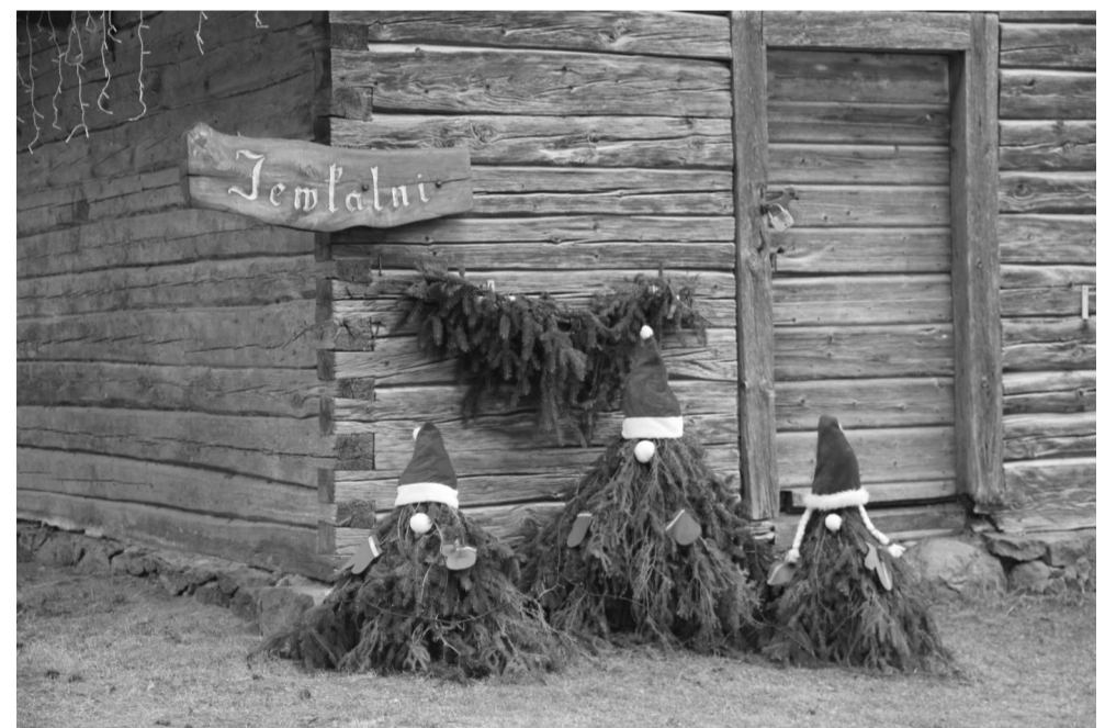
Vakaros, kad satumst, pie "Ievkalniem" garām gājējus un braucējus piecē gan rūķi, gan izgaismotā klētiņa un eglīte