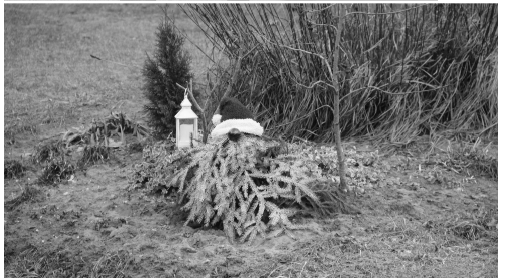
Īpašu svētku noskaņu noskaņu ir radījusi Pārupu ģimene, kuru piemājas dārzā sasēdeši rūķi ar sarkanām cepurēm