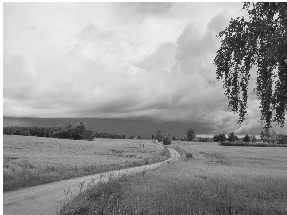
Ķoņu pagasta dabas ainava no Solveigas Šķiņķes telefona foto izstādes “Mirkļi dabā”, kas būs aplūkojama līdz nākamā gada 15.janvārim Ķoņos “Zirgu pasta stacijā”

Kadrija Mičule, Ķoņu bibliotēka/tautasnams