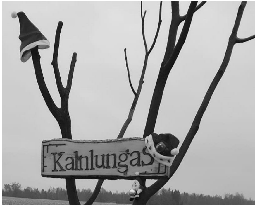
Ķonu pagastā "Kalnlungu" māju nosaukums svētku rotā

Kādā 24 dzīvokļu mājā kaimiņi dzīvoja kā jau kārtīgi kaimiņi - citi strīdējās, citi draudzējās, dažkārt kādā talkā kaut ko darīja kopā, kādreiz dusmojās viens uz otra suņiem, kaķiem, bērniem un autobraucējiem.... parasta daudzdzīvokļu mājā ar parastiem kaimiņiem. Bet kādā Jaungada naktī, tā ap pusnakti, notika dīvaina lieta – pie katra no daudzo dzīvokļu durvju rokturiem bija piesieta iesaiņota piparkūku sirdis, kuru rotāja ar glazūru rakstīts laba vēlējums. Kāds no kaimiņiem to pamanīja drīz pēc pusnaktis, nākot mājās no salūta skatīšanās pagalmā, cits - no rīta, mostoties un dodoties dienas gaitās, kāds piparkūku sirdi atrada tik pēc dažām dienām, atgriežoties no svētku ciemošanās pie radiem. Visi bija neizpratnē, minēja, sačukstējās, strīdējās, cenšoties uzminēt, kurš bija piparkūku siržu autors, šī tēma ik pa brīdim vienoja kaimiņus sarunās vēl vairāku nedēļu garumā. Kāds varbūt uzminēja vaininiēku , bet tā īsti atklāts tas netika. Gāja laiks, noziedēja ābeles, margrietīņas un mārtiņprozes, jau