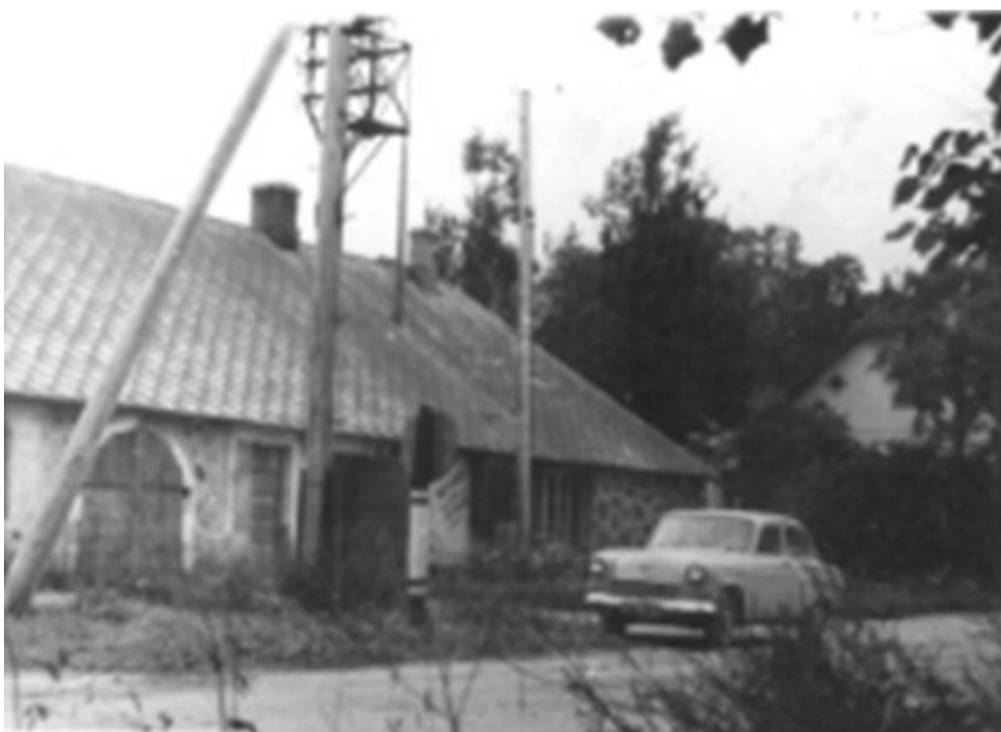
"Strēlnieki", kurā ilgu laiku atradās Naukšēnu pasta nodaļa