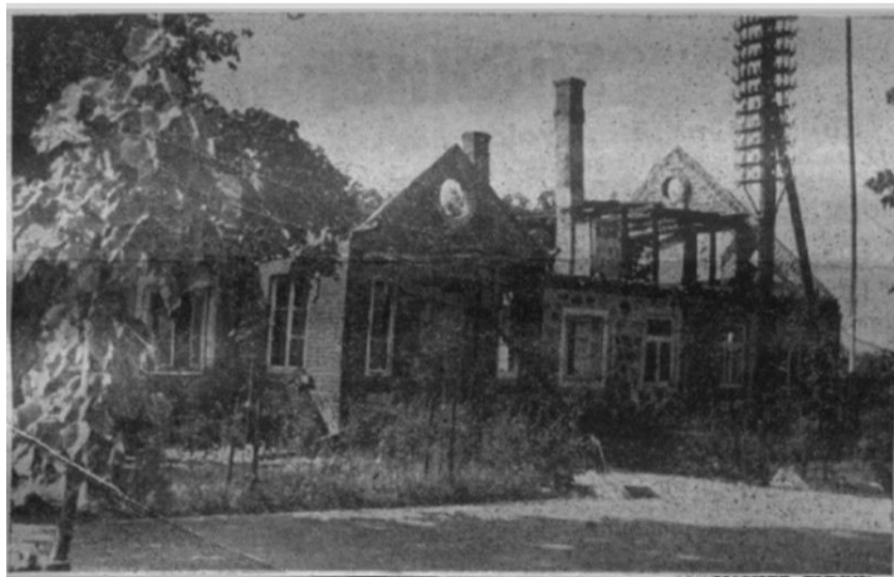
Ēka, kurā atradās Naukšēnu pasts, pēc ugunsgrēka 1939. gada 30. jūlijā