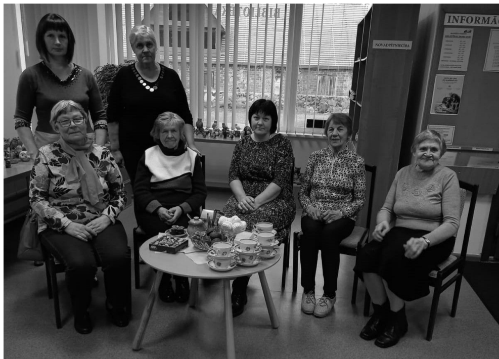
Tikšanās Naukšēnu bibliotēkā, lai pārrunātu Naukšēnu pasta vēsturi

Deviņdesmito gadu sākumā pasts pārceļas uz "Smilgām". Šeit telpas mazas, vasarā ļoti karsts. Kad patērētāju biedrības veikals tiek likvidēts pasts mājvietu rod pašvaldības ēkā, kur pastāv līdz tā likvidācijai.