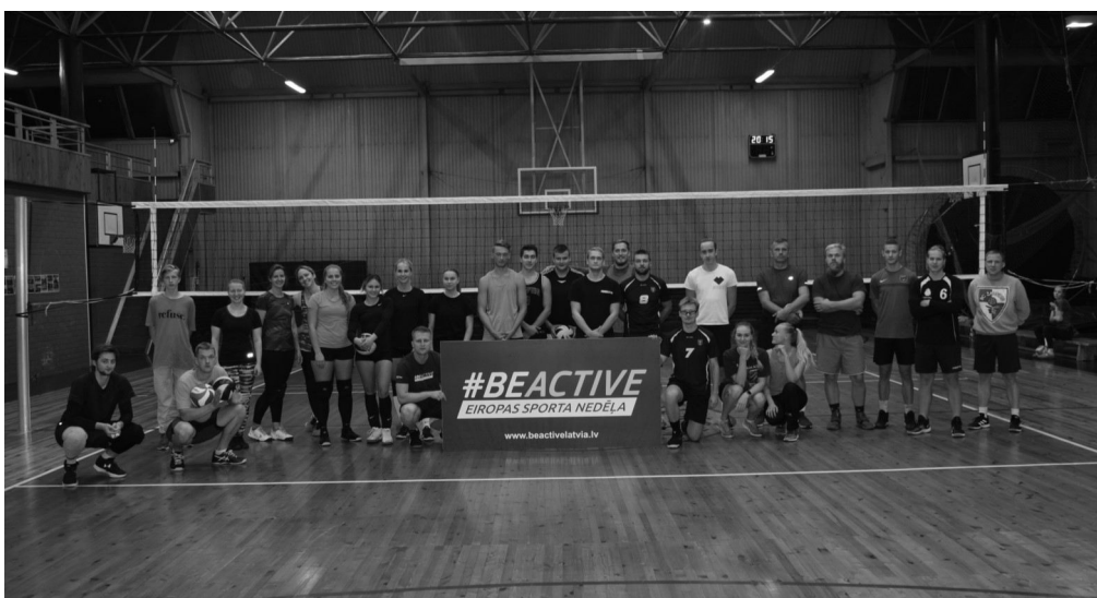
Nakts volejbola turnīra dalībnieki Naukšēnos

Teksts un foto Gundars Putniņš Sporta darba organizators