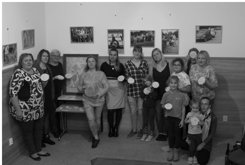
Dāmas apguvušas pirmās iemaņas dekoratīvo augu bareljefu izgatavošanā

Meistarklases, kurās var papildināt zināšanas, gan darboties praktiski, ir guvušas atsaucību. Apmeklēta bija arī nodarbība par dabīgo kosmētiku. Uzzinājām, kādas izplatītākās vielas satur kosmētika, kuru ikdienā lietojam – krēmi, mazgāšanas līdzekļi, šampūni, kā atpazīt ķīmiskas un dabiskas izcelsmes izejvielas, tās arī mācījāmies atrast, lasot līdzpaņemtās kosmētikas sastāvdaļas, secinot, ka tikai dažos iepakojumos izdodas neieraudzīt ķīmisku vielu klātbūtni, uzzinājām, ka šīs vielas patiesībā nepalīdz ādas dabiskajam skaistumam, bet ražotāji ar tām aizstāj dabīgās, lai produkciju padarītu lētāku. Otrajā daļā ķērāmies pie ķermeņa skrubiņa gatavošanas. Interesanti, ka