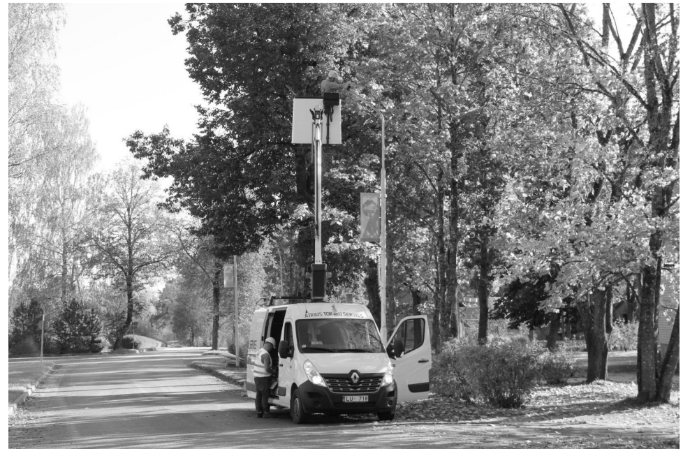
Naukšēnu centrā notika ielu apgaismojuma nomainīšana uz galvenajām ielām – centrālās ielas un virzienā "Dronas - Purapuķes". Kopumā tika nomainītas 58 LED lampas.