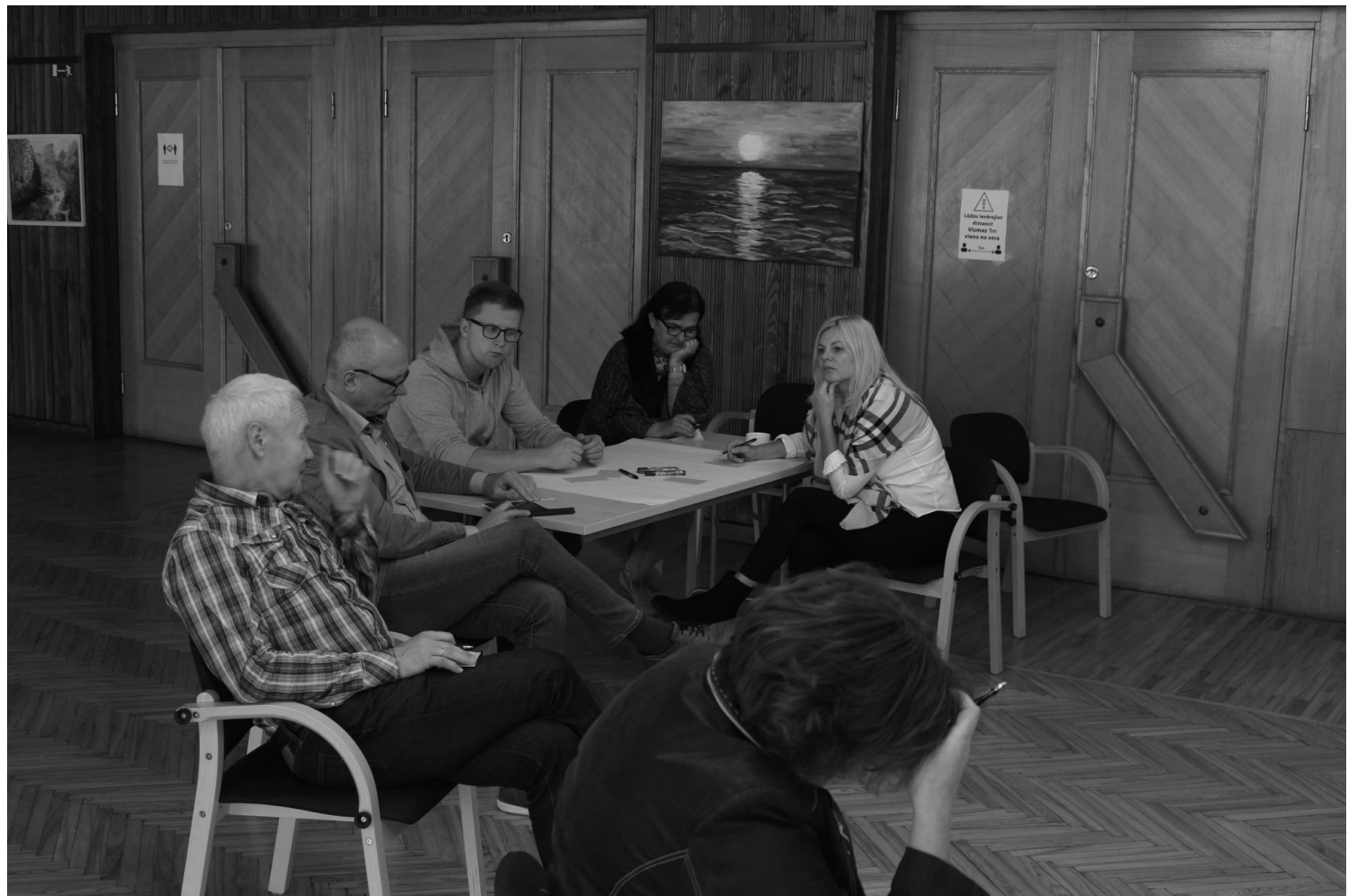
Uz pirmo Naukšēnu novada domradi sanākušie dalījās ar idejām kādus jauninājumus un uzlabojumus viņi saredz novada teritorijā

Bijām tikai astoņi naukšēnieši, bet idejas tika izteiktas daudz: par represēto akmens labiekārtošanu Naukšēnos, Ķoņu Zirgu pasta stacijas ēkas un Dīķeru muižas labiekārtošanu un izmantošanu, velosipēdu nomas ierīkošanu, vietējo mājažotāju produkcijas tirdzniecības vietas ierīkošanu, arī tirdzniecību internetā, audēju telpas paplašināšanu kultūras namā, komposta vietas izveidi pie daudzdzīvokļu mājām, apspriesta bērnu peldvietas atjaunošana pie sporta halles, starptautiska Landart festivāla rīkošanu Ķoņu kalnā, vietvārdu talku, vietējās vēstures un ģeogrāfijas izziņāšanu, ekskursijām, lai labāk iepazītu vietējos uzņēmējus un radošos