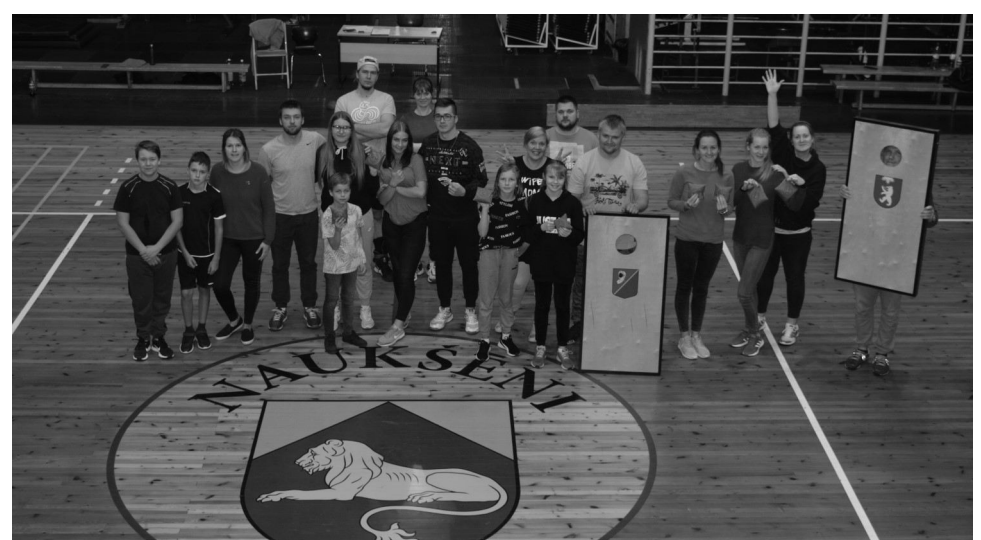
Dalībnieku priecīgās sejas liecina, ka tikko apgūtais sporta veids - cornhole , visai labi patīk