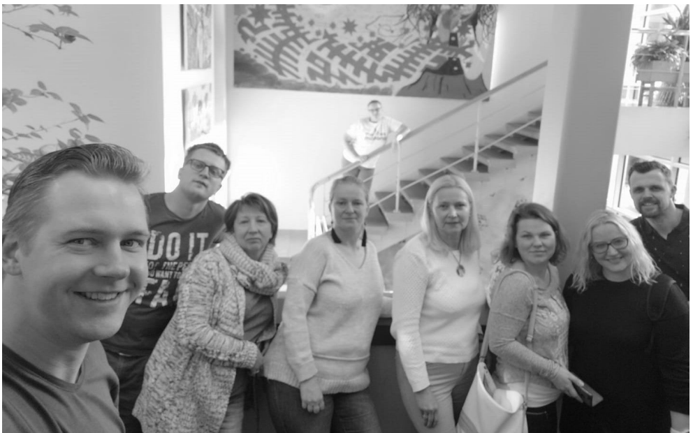
Projekta ietvaros speciālistiem bija iespēja apmeklēt jauniešu centrus Alūksnes, Gulbenes, Madonas un Vecpiebalgas novados