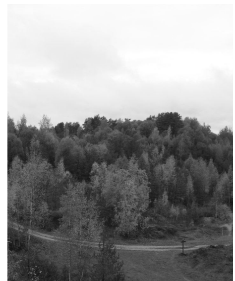
Skats no Ķoņu kalna oktobrī

Teksts un foto Diāna Glušonoka muzeja vadītāja