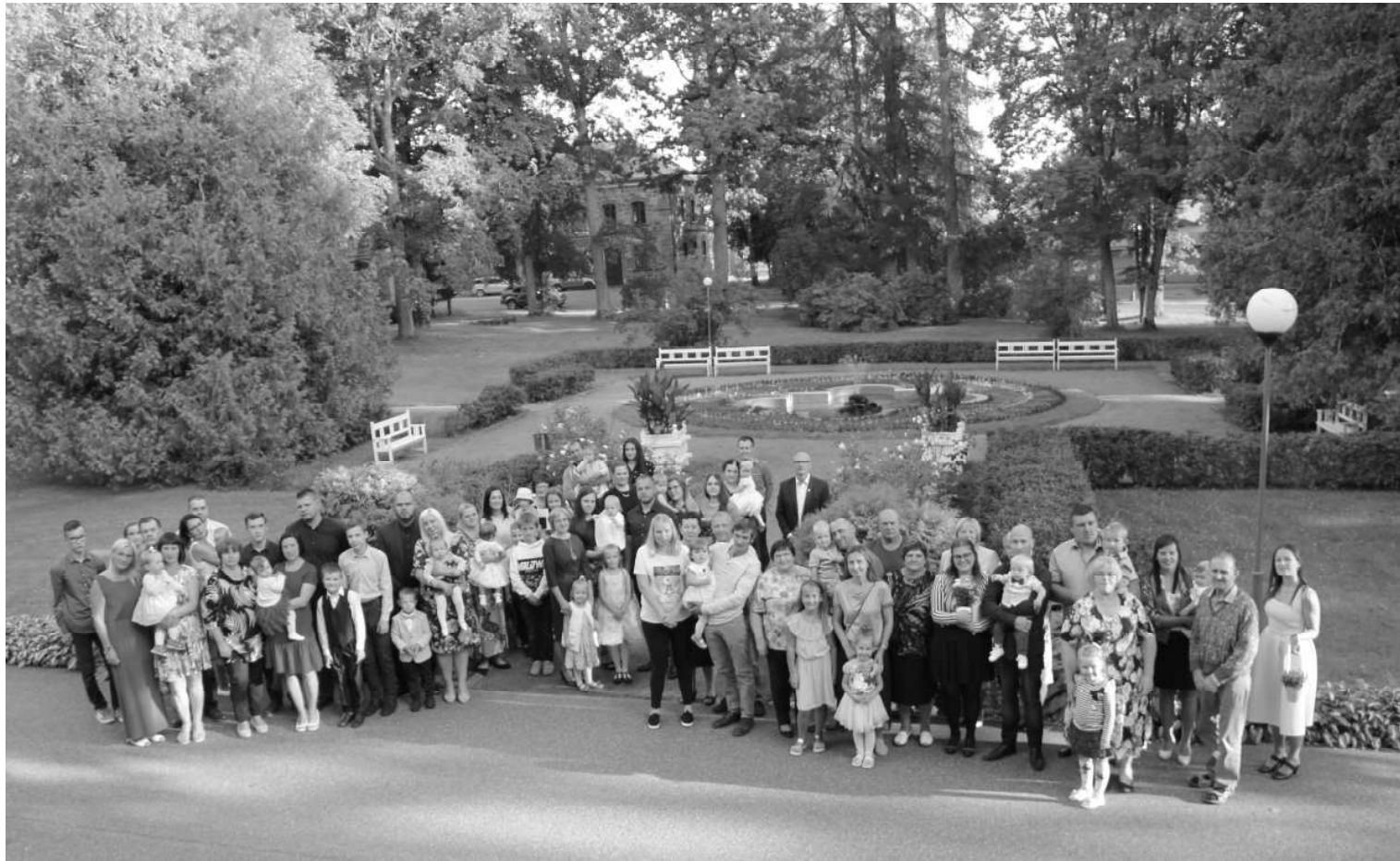
"Mazais novadnieks 2019" pasākuma dalībnieki Naukšēnu muižas pagalmā

Kā ierasts, pašvaldība mazajiem novadniekiem dāvināja piemiņas monētu, kuras aversā iegravēts katra bērniņa vārds, dzimšanas gads un uzraksts "Mazais novadnieks", savukārt reversā iegravēts Naukšēnu novada ģerbonis. Tāpat katra ģimene saņēma "Mazā novadnieka" Goda rakstu. Neizpalika arī svētku torte un kopīga fotografēšanās. Par pasākuma muzikālo noformējumu