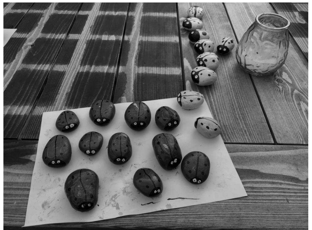
Krāsainas mārītes spēli padarīs jautrāku