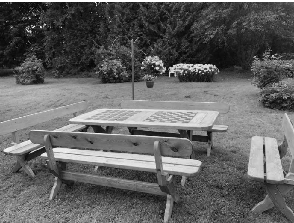
Daudzdzīvokļu dzīvojamās mājas “Upleju” pagalmā kopīgiem atpūtas brīžiem ir uzstādīti piknīka galdi un krēsli uz kuriem var spēlēt dažādas spēles