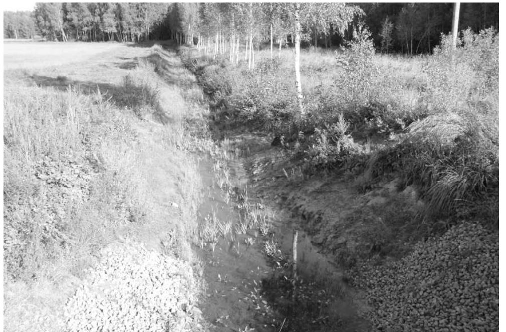
Meliorācijas sistēma "Rausele" pēc apauguma novākšanas, grāvju atjaunošanas, caurteku nomaiņas un galu nostiprināšanas