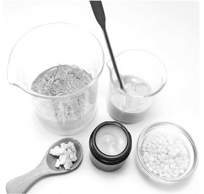
No klijģerīšu ziediem gatavots dabīgais dekoratīvais krēms

Vāksim makulatūru! Vai Tu zini, ka izmantojot pārstrādei 100 kg makulatūras, tiek nenocirsti 2 koki, ietaupīti 450 l ūdens un 2860 kWh elektroenerģijas, kas būtu nepieciešami, lai šos divus kokus pārvērstu papīrā? Izlasītie žurnāli vai neaktuālās grāmatas mājās aizņem vietu, metot atkritumos, par to ir jāmaksā, arī lāga sadedzināt tos neizdodas... Kāpēc gan tos nenodot pārstrādei? Makulatūras savākšanas konkurss ik gadu apvieno simtiem iedzīvotāju un organizāciju darbinieku, veidojot sabiedrības izpratni, ka katra nolietota grāmata, periodikas izdevums, reklāmas buklets, nevajadzīgi papīri, kartona kaste var uzsākt jaunu – otru dzīvi un ir nozīmīgs posms jaunu produktu ražošanā. Arī Ķoņu bibliotēka šogad piedalās makulatūras vākša-