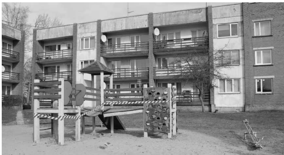
Šajā vasarā daudzdzīvokļu mājas "Egles" un apkārtējo māju bērni realizēs savas idejas kopā ar vecākiem, lai atjaunotu rotaļu laukumu

Pašvaldības izveidotajai komisijai piecu locekļu sastāvā, izvērtējot visus projektus, par labāko un nepieciešamāko tika atzīts "Rotallaukuma atjaunošana" pie daudzdzīvokļu mājas "Egles", kur par 500 EUR tiks atjaunotas salūzušās un nolietotās rotaļu laukuma konstrukcijas esošajā rotaļu laukumā. Iedzīvotāju grupa "Uplejas dara kopā" – daudzdzīvokļu mājas "Uplejas" iedzīvotāji, vēlas labiekārtot savas mājas apkārtni, izveidojot pagalmā atpūtas stūri ar pagalma mēbelēm - galdu un četriem