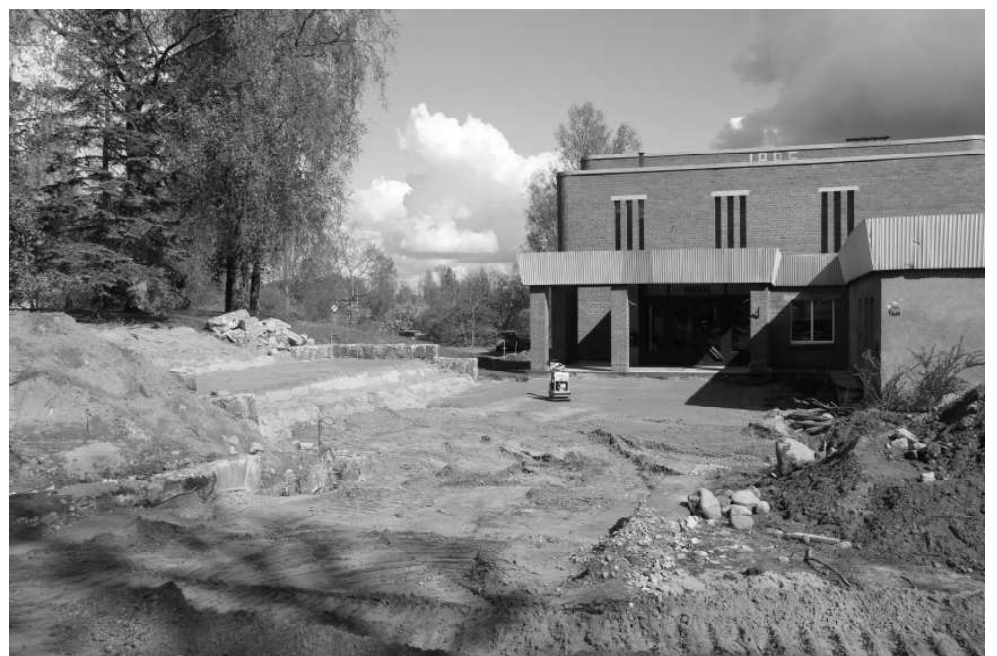
Labiekārtošanas darbi pie Naukšēnu kultūras nama