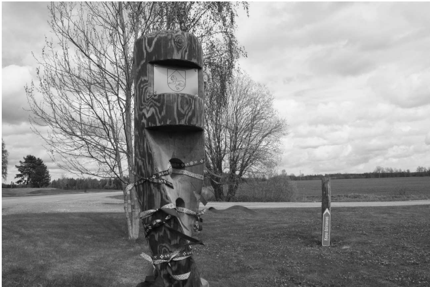
Fonda "1836" projekta "Aplido, apceļo, apmīļo Latviju!" ietvaros pie Ķoņu dzirnavām kā Latvijas pierobežas simbols ir ierakts ceļa stabs, kuru rotā Naukšēnu novada ģerbonis

Tu vari iegādāties "1836" gājēju karti, ar mērķi apiet Latviju. Kaut vairākos gados. Ceļš apkārt Latvijai sadalīts 4 mazākos posmos – Ziemeļmeitas ceļš,