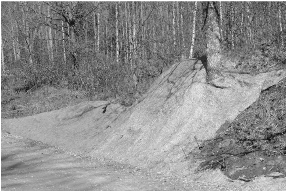
Vietām, kur tas bija nepieciešams, grāvja mala ir nostiprināta ar speciālu materiālu, lai nenotiktu nogrūvums