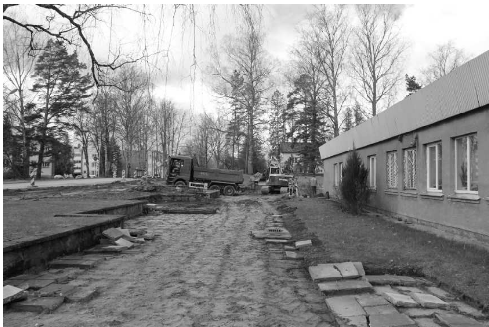
Turpinās projekta "Naukšēnu kultūras nama apkārtnes labiekārtošana, "Putniņi", Naukšēni, Naukšēnu pagasts, Naukšēnu novads" realizācija. Saskaņā ar būvprojektu būvniecības laukums ir atbrīvots no kokiem un plāksnēm, bet pašreiz noris apauguma un vecās grunts noņemšana un aizvešana.

Labiekārtošanas darbu izdevumi tiks segti no pašvaldības budžeta, Lauku atbalsta dienesta LEADER programmas finansējuma un biedrības "No Salacas līdz Rūjai".