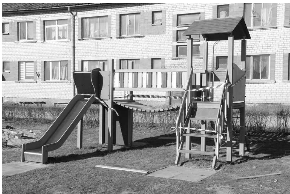
Aicinām vecākus sekot līdzi savu bērnu un pusaudžu gaitām ārpus mājas un skaidrot pašreizējās ārkārtējās situācijas nopietnību. Lūgums nepulcēties vairāk kā diviem cilvēkiem un ievērot 2 metru distanci sporta laukumos un stadionā Naukšēnu novadā, kā arī citviet. Tāpat krīzes situācijā ir slēgti visi rotaļu un treniņu laukumi.

Jauki, ka mūsu vidū ir tādi jaunieši, kuri prot savu brīvo laiku pavadīt aktīvi un sportiski, bet pašreizējā situācija prasa līdzdarboties tieši mūs – sabiedrību. Tādēļ aicinām ievērot sabiedrisko distancēšanos un atlikt sporta aktivitātes uz vēlāku laiku. Būsim atbildīgi un līdzdarbosimies savai un apkārtnes drošībai!