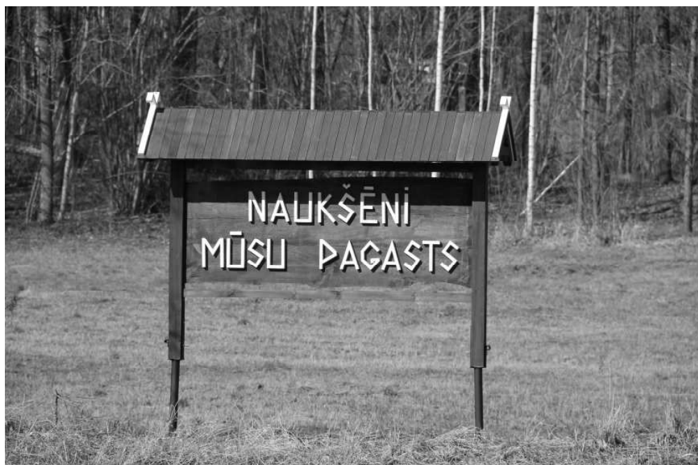
Naukšēnu centrā Rūjas upes krastā pēc zemes īpašnieka iniciatīvas uzstādīts vides objekts – Naukšēni mūsu pagasts. Tas priecē!