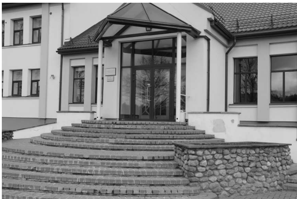
Kopš skolēni mācās attālināti no mājām, skola ir slēgta, bet pastāverība, ka jaunais mācību gads varēs iesākties kā ierasts