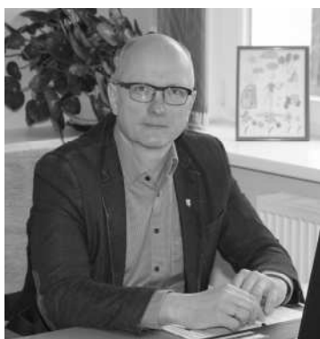
Cienījamie Naukšēnu novada iedzīvotāji!

Teksts un foto Nora Kārklīņa sabiedrisko attiecību speciāliste