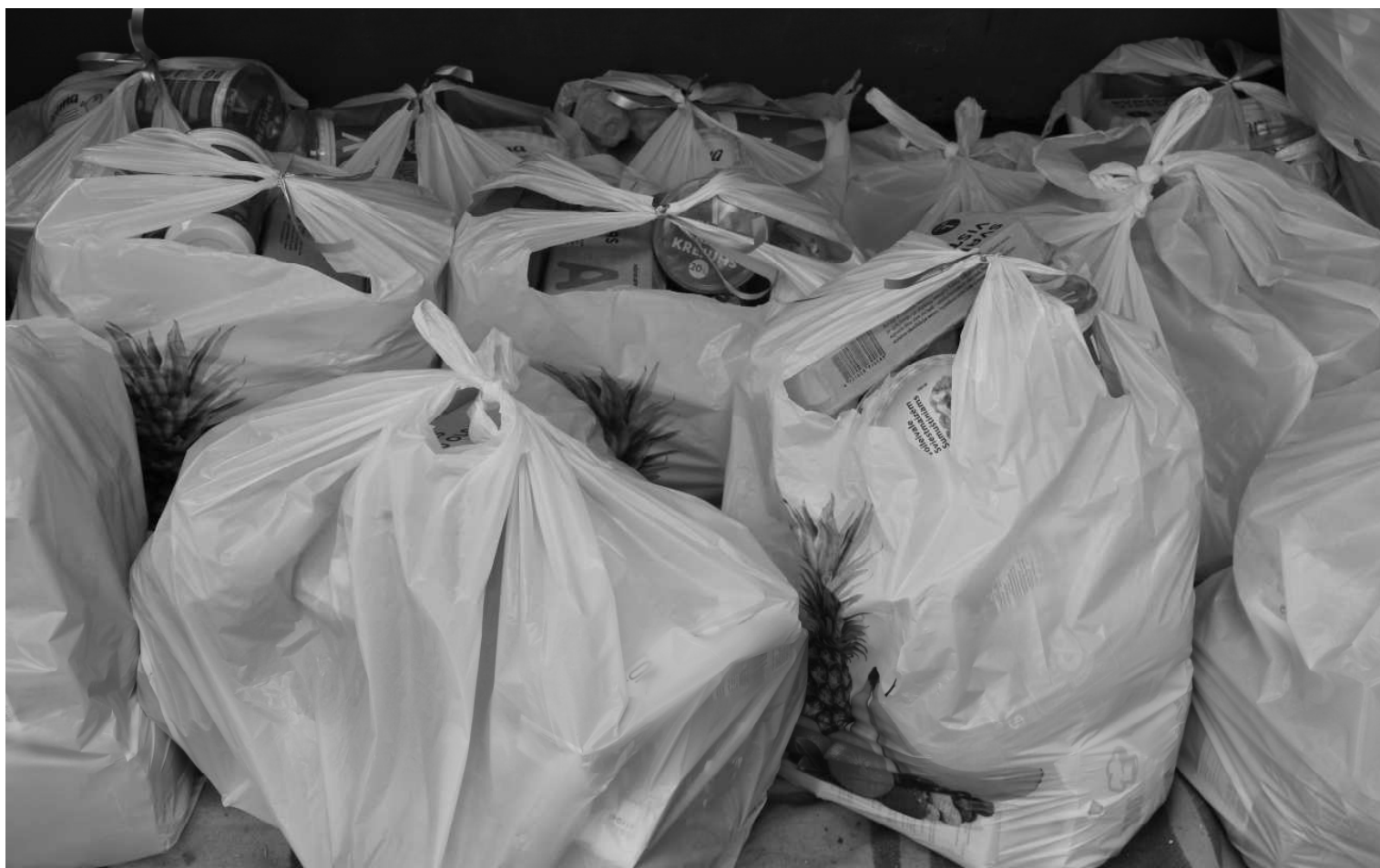
Valstī izsludinātās ārkārtas situācijā pašvaldības sarūpētas pārtikas pakas Naukšēnu novada skolēniem, kuri nāk no trūcīgām, maznodrošinātām vai daudz bērnu ģimenēm ir atbalsts ģimeņu budžetam

Pārtikas paku piegādi organizē Naukšēnu novada vidusskolas darbinieki, sadarbībā ar Sociālo dienestu. Otro pali-