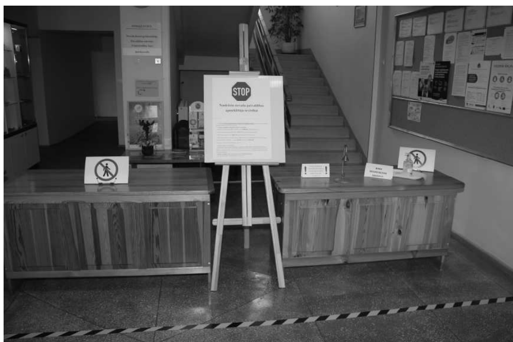
Lai pēc iespējas samazinātu risku un ierobežotu vīrusa Covid - 19 izplatību, Naukšēnu novada pašvaldībā apmeklētājiem turpmāk būs ierobežota pārvietošanās. Lūdzam apmeklētājus ievērot, ka ienākot pašvaldībā, jāpiezvana zvaniņš, kas atrodas uz galdā. Darbinieks izdzirdot zvaniņa signālu, ieradīsies, lai Jums palīdzētu. Aicinām izvērtēt nepieciešamību apmeklēt pašvaldību klātienē!

Labiekārtošanas darbu izdevumi tiks segti no pašvaldības budžeta, Lauku atbalsta dienesta LEADER programmas finansējuma un biedrības "No Salacas līdz Rūjai".