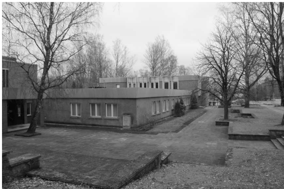
Priekšlaukums pie Naukšēnu kultūras nama un SIA "Naukšēni" kantora pirms pārvērtībām