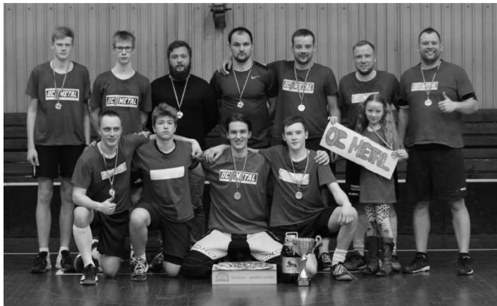
Naukšēnu novada florbola entuziastu turnīra uzvarētāj komanda "OC Metal"