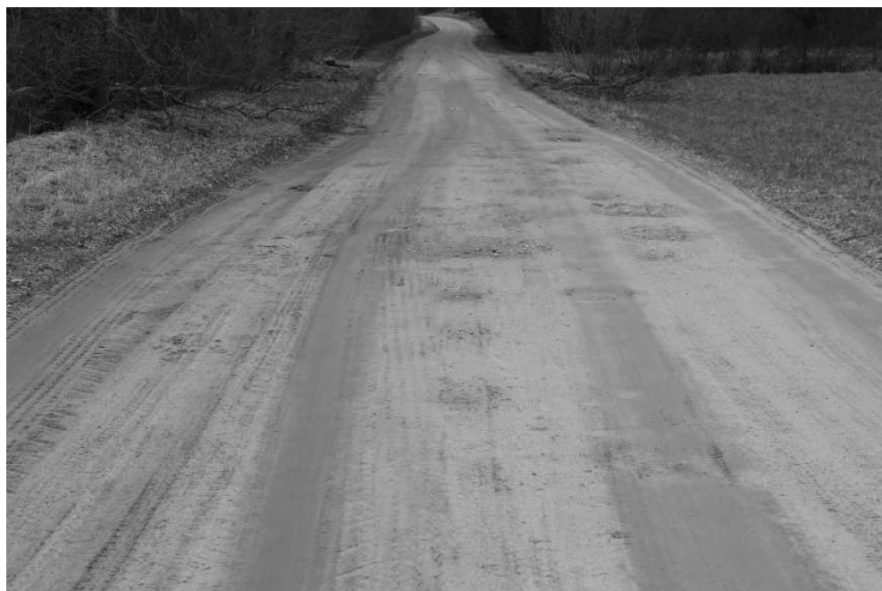
Pašvaldības autoceļš Breidas—Zemgaļi

Ceļa pārbūvi veiks piegādātāju apvienība "Valkas ceļi un Vianova", kuras dalībnieki ir SIA "Valkas ceļi" un SIA "Vianova", būvuzraudzību nodrošinās