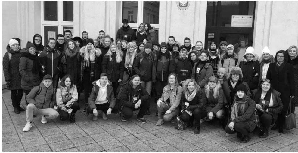
Erasmus+ projekta dalībnieki viesojoties Polijā Šubinā

Projekta partnerskola bija Staņislava Vuspjanska ( Stanislaw Wyspianski ) vidusskola Šubinā ( Szubin ). Pirmajā dienā viesi tika iepazīstināti viens ar otru, ar skolu un tās darbību. Noskatījāmies skolēnu sagatavotu priekšnesumu – dziesmas un teātra uzvedumu skolēnu izpildījumā. Lai labāk iepazītos viens ar otru, skolēni tika sadalīti jauktās grupās. Tās tika informētas par projekta mērķi un veicamajiem uzdevumiem. Pirmais brauciens bija uz netālo pilsētu Budgošu ( Bydgoszcz ), kas lepojas ar savu senatnīgo arhitektūru, katedrālēm, kurās vēl joprojām var atrast paslēptus dārgumus, muzejiem un skulptūrām. Viena no ievērojamākajām skulptūrām – vīrs, kurš balansē uz vīrves pāri upei. Apmeklējām arī netālu mežā un zem zemes paslēpto muzeju – Eksplozijas rūpniecību, kur 2.pasaules kara laikā tika ražots nitroglicerīns kara vajadzībām. Muzeja platība pārsniedz 19 000 m 2 . Ejoj pa rūpniecības pazemes koridoriem, apmeklējot izstādes telpas, klausoties gida stāstīto, varējām gūt priekšstatu par rūpniecības varena-