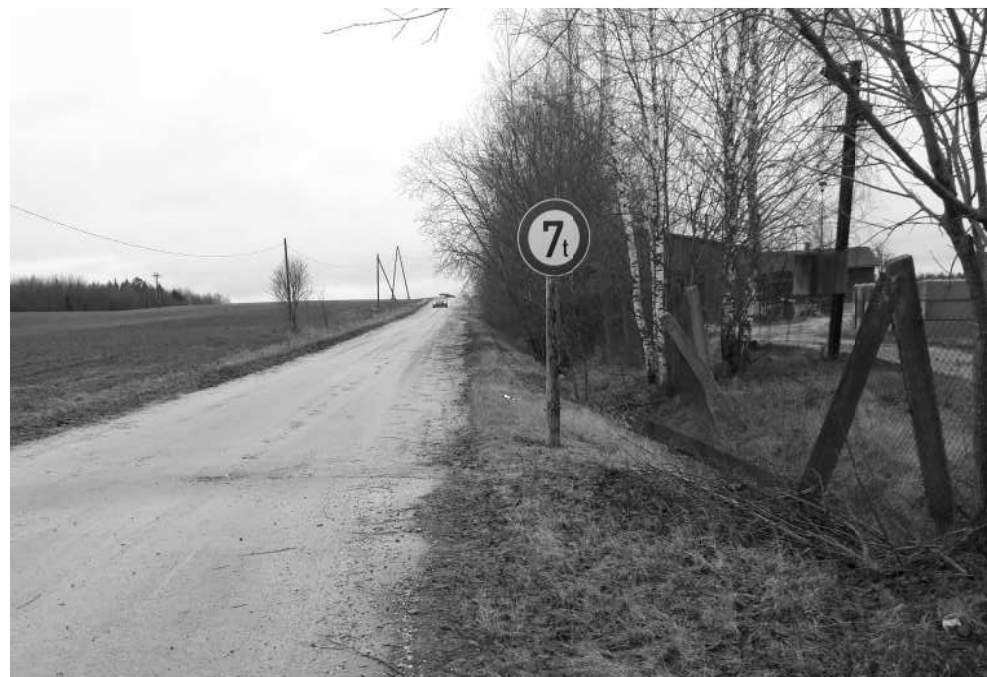
Pašvaldības autoceļš Celtnieki - Miglas Ķoņu pagastā