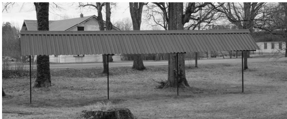
Naukšēnos daudzdzīvokļu mājas "Lapegles" iedzīvotāji, piedaloties konkursā "Mēs savam novadam" gan 2018., gan 2019.gadā, pagalmā uzbūvēja veļas žāvētavu, kas apkārtni vidi padara daudz patīkamāku.

Būsim aktīvi un radoši, tā ir lieliska iespēja iegūt finansējumu tādām lietām, kuras padara mūsu ikdienu un apkārtni vidi patīkamāku.♦