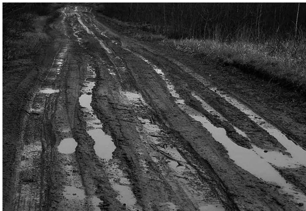
Ceļš Piksāri – Omuļi

Ceļa garums no Piksāriem līdz Valkas novada robežai ir 7,58 km. Pārņemšanas brīdī tas bija kā uzlabotas grunts seguma ceļš, faktiski – bezseguma. Pa šiem gadiem Naukšēnu novada pašvaldība finansāli iespēju robežās un arī iesaistot vietējos uzņēmējus ir daudz darījusi, lai