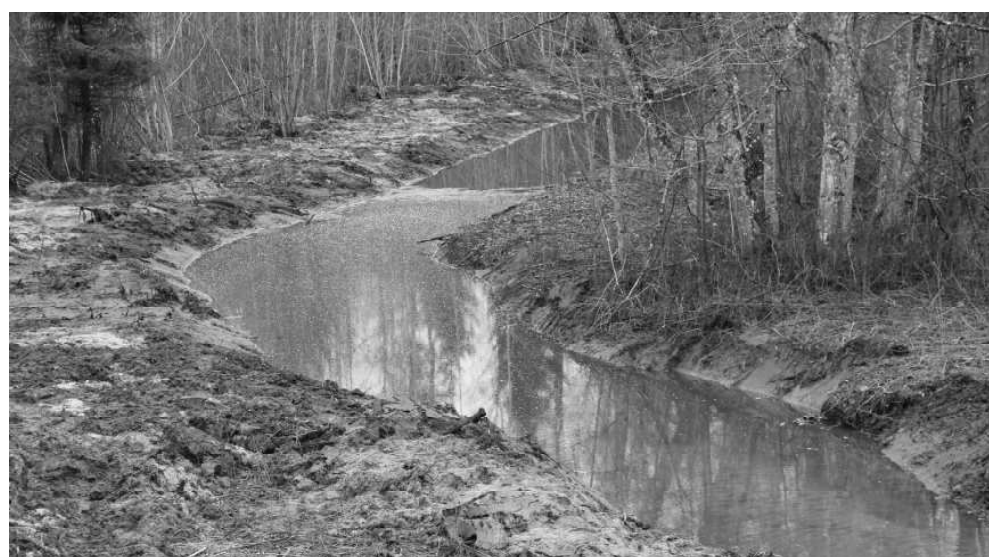
Meliorācijas grāvis "Rausele" Naukšēnu pagastā pēc apauguma novākšanas un grunts izrakšanas