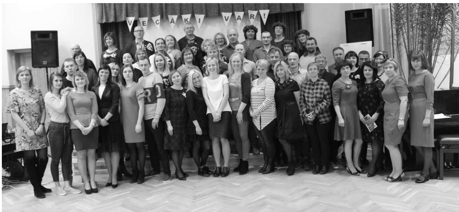
Vecāku vakara “Vecāki var!” dalībnieku komandas

Četras bildes, viens stāsts un viena dziesma. No attēlā redzamajām četrām bildēm komanda izstāstīja savu stāstu un nodziedāja atbilstošu dziesmu.