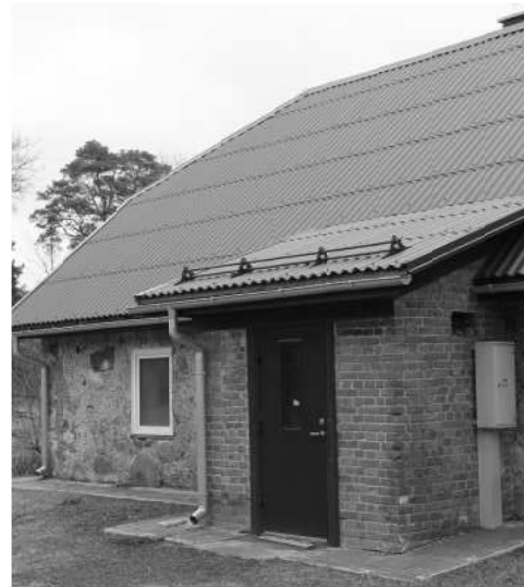
"Mazaldaru" ēka no ārpuses